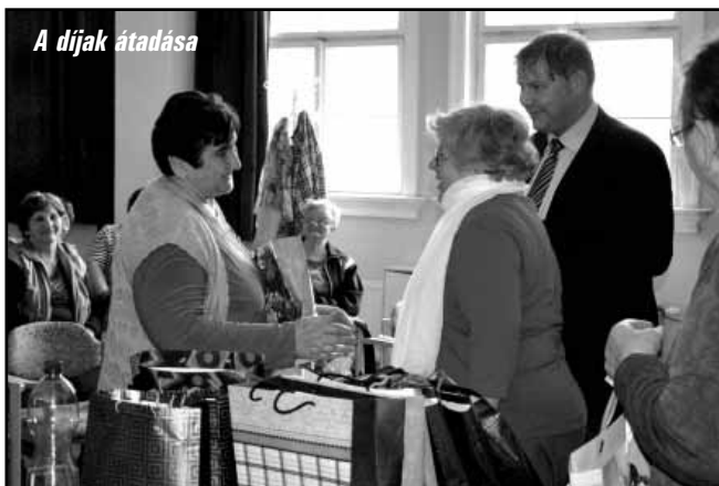
A díjak átadása