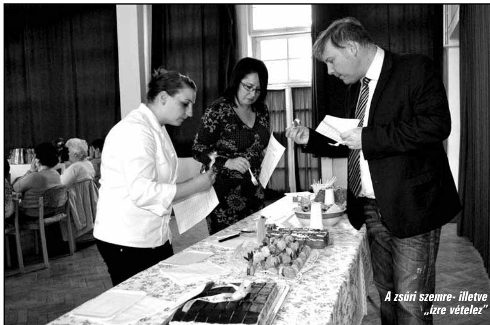
A zsűri szemre- illetve „ízre vételez”