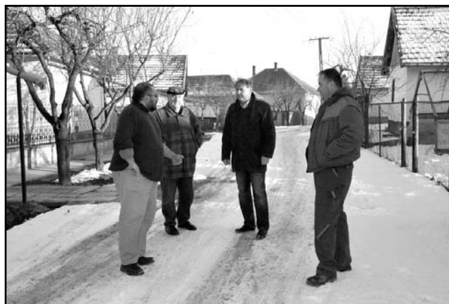
... és a Hatház utcát

elektronikus megosztó oldalakon. Ellenben ezek rendkívül alkalmasak a félígazságok és valóságtól elrugaszkodott, néha személyeskedő hangvételű magánvélemények terjesztésére. Sajnálatosan az ilyen írárok szerzői kivétel nélkül elkerülték önkormányzatunk hivatalos kapcsolat felvételi formáit. Építő és tényekkel alátámasztott kritikai észrevételeiket egyetlen alkalommal sem juttatták el hozzánk. Szerencsére városunk lakossága a problémák észlelését követően a legrövidebb időn belül személyesen vagy telefonon értesítéssel élt irányunkban, melyet ez úton is köszönni tartozunk. Az építés időtartama és jellege miatt ezen bejelentésekre a legmegfelelőbb reakciót kértük a kivitelezőtől, mely sajnálatosan nem minden esetben jelentett végleges, megnyugvásra okot adó megoldást.