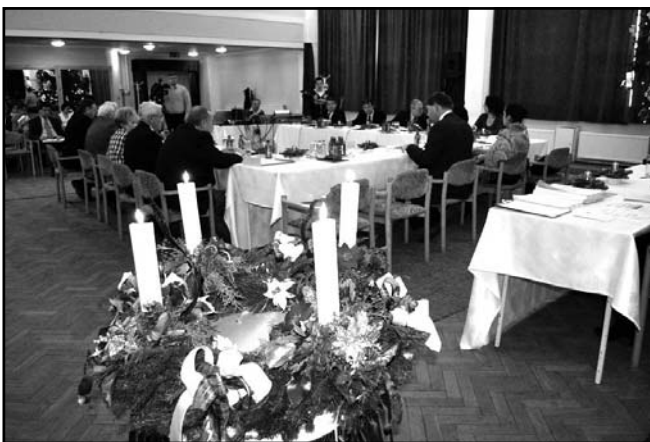
A munkautalás idején is égtek a gyertyák

A képviselő-testületi ülésen a továbbiakban döntés született a LEADER munkaszervezet működésének finanszírozásáról, ugyanis Sarkad is érdekelt a pályázatok megvalósításában, ezért 515.000 Ft-tal járul hozzá a munkaszervezet működéséhez. (2009 és 2013 között összesen 267 millió forint összegű LEADER pályázati forrás érkezett Sarkadra az önkormányzathoz és a civil szervezetekhez.) Döntés született a Polgármesteri Hivatal nagy- és kis tanácskozó termének 2015-ben esedékes rekonstrukciójának előkészítéséről, valamint a Délkelet-Alföld Regionális Hulladékkezelési és Környezetvédelmi Rendszer Létrehozását Célzó Önkormányzati Társulás részére a 2015. évben esedékes tagdíj biztosításáról is. Döntöttek a képviselők arról, hogy a harmadik, az ötödik, és a nyolcadik egyéni