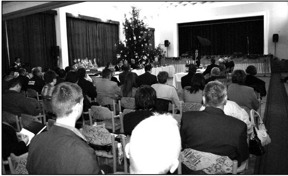
Ünnepi díszbe öltöztetve a művelődési központ nagyterme, ahol a város polgármestere szolt elsőként

A harmadik napirendi pontban egy sor önkormányzati rendeletet alkotott meg vagy módosított a képviselő-testület. Ennek mentén sor került Sarkad Város Önkormányzata 2014. évi költségvetési rendeletének módosítására, melyből megtudhattuk, hogy a költségvetés bevételei és kiadásai főösszege mintegy 6 milliárd forint. Ebből 3 milliárd forint