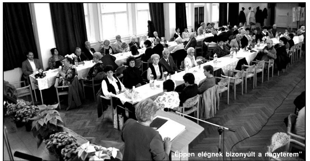
„Éppen elégnek bizonyult a nagyterem”

Központban, amelyen a tagság mellett társ nyugdíjas szervezetek képviselői is megjelentek. Éppen elégnek bizonyult a művelődési ház