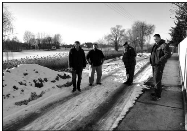
... a Körös utcát...