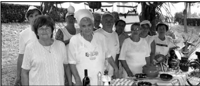
Négy pillanatkép az egyesület múlt évi eseményeiből

A Gyulai Cégbíróságnál 1989. november 20-i dátummal jegyezték be az egyesületet.