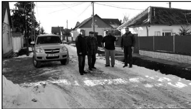
A város előjárói megvizsgálták a lakossági bejelentések által érintett utcákat. A Bojtó utcát...