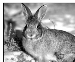
Télen a vadnyúl a facsemeték réme (a kergét lerágyja)

A fejlesztésnek köszönhetően 700 db. gyümölcsfa került elültetésre a Gyulai úti általános iskola mögötti kertben. A szakemberek által kiválasztott gyümölcsfák (meggy, cseresznye, sárga- és őszibarack, öt fajta, egymást követően érő alma és birsalma) a mezőgazdasági projekt keretében kerülnek gondozásra, így a projektnek köszönhetően a város rászoruló lakossága és a helyi közéletetetés számára nagy mennyiségben fog rendelkezésre állni a gyümölcs. A 700 fából álló kertben megtermelt gyümölcsök egyrészt frissen kerülhetnek elfogyasztásra, illetve adományozásra, másrészt aszalás és lekvár főzés céljából fogja azt tovább-