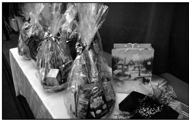
Átadásra várokoztak a képviselők ajándékai