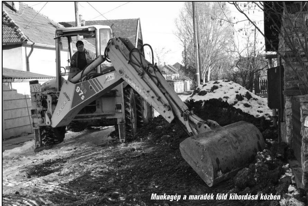
Munkagép a maradék föld kihordása közben

Az elmúlt időszakban számos alkalommal érkezett bejelentés mindkét helyre. Korábbi tájékoztatásaink alkalmával is óva intettünk minden érintett, hogy a kontrollálhatatlan információknak ne adjanak hitelt. Önkormányzatunk nem kommunikál közösségi portálokon,