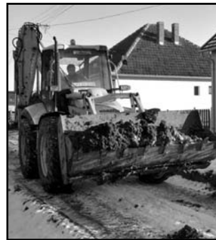
Tisztelt Sarkadi Lakosok!

A szennyvíztisztító telep építése lassan eléri a próbaüzemi állapotot, mely során a teljes kapacitás vizsgálata elindul. Eredményes próbaüzemet követően a jogerős hatósági engedély birtokában vehetjük igénybe a tisztítót. A tisztító megfelelő működtetéséhez ellenben még szükséges három nyomvezeték kiépítése is, melyek a végtemelők leterheltségén, s az ebből fakadó üzemzavarok elhárításán segítenek majd. Az építés véghatáridejéhez közeledvén a kivitelező meg fogja kezdeni az érintett utcák nyomvonalainak végleges helyreállítását, mely az eredeti állapotnak megfelelő minőségű kell legyen. Az eredeti állapotot a teljes építési területre kiterjedő kiindulási állapotot bemutató fotó-videó dokumentáció mutatja be, mely önkormányzatunk birtokában van. Sor kerül még 50 db meglévő akna felújítására, valamint elsősorban Béke-sétány és csatlakozó csatornaszakaszok rekonstrukciójára is, mely béléleses illetve teljes átépítéses módon fog megvalósulni.