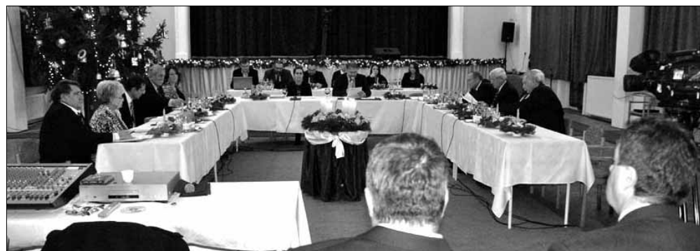
Az ünnepi testületi ülés második részében a képviselők az adventi gyertyák fényénél a város dolgaival foglalkoztak