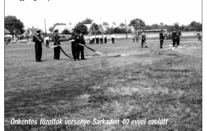
Önkéntes tűzoltók versenye Sarkadon 40 évvel ezelőtt

a megkapta azt a szakmai tevékenységét elismerő lehetőséget az országban az elsőként önállóan beavatkozó egyesületté válhatott.