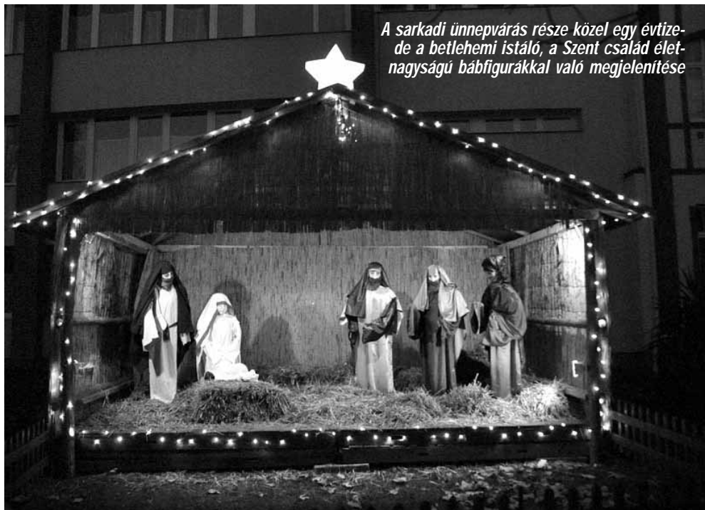
A sarkadi ünnepvadás része közel egy évtizede a betlehemi istálló, a Szent család életnagyságú bábfigurákkal való megjelenítése

A magyar karácsonyi ünnepkör egyik legkedvesebb szokása a betlehemezés. Házról-házra jártak és némi harapni- és koccintanivaló kíséretében mutatták be játékkukat a betlehemes legények. Ebben a hagyományos játékban Jézus születésének eseményei elevenednek meg, ma már inkább csak a Szent család szállításának, a pásztorok imádása, esetleg a háromkirályok látogatása, többnyire gyermekek előadásában. A középkorban azonban az egész karácsonyi eseményt felvont férfiak mutatták be misztériumjátékok keretében a templomban. Ezek egyikének sem ismerjük a szövegét, de a 17–18. századtól a laikus társaságok előadásai iról már maradtak fenn tudósítások. A 19. századtól a betlehemezés két formáját láthatjuk: a bábokkal és az élő szereplőkkel megjelenített