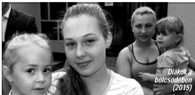
Diákok a bölcsődében (2015)

A program célcsoportjába azok a 16-25 év közötti, nappali tagozaton tanulói vagy hallgatói jogviszonnyal rendelkező diákok tartoznak, akik nem rendelkeznek sem vállalkozói, sem egyéb foglalkoztatásra irányuló jogviszonnyal. A foglalkoztatás történhet a települési önkormányzatnál, illetve az önkormányzat fenntartásában álló, önkormányzati alapfeladat ellátását végző intézmény-nél. Legfeljebb napi 6 óras foglalkoztatáshoz nyújt a