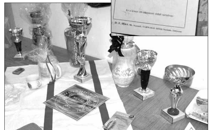
A tagság személyes tárgyai közül válogatott kiállítás