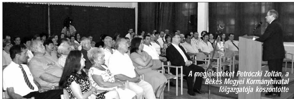
A megjelenteket Petróczki Zoltán, a Békés Megyei Kormányhivatal főigazgatója köszöntötte

tal főigazgatója köszöntötte, aki beszédében kiemelte a teremben ülő dolgozók egész éves áldozatos munkájának fontosságát, továbbá köszönetet mondott az állampolgárok egész esztendőn át tartó szolgálatáért. Az ünnepi köszöntő után újra Kovács Kinga és Karkus Tamás léptek színpadra, akik ismert zeneszámokkal szórakoztatták az ünnepelteket.