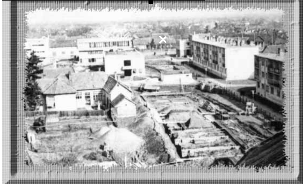
A kép a belvárosi református templom tornyának keleti ablakából készült és Sarkad épülő belvárosát örökítette meg kb. a 70-es évek elején. A Béke sétány 28 lakásos épületének az alapozását végzik, távolabb (fehér X) a „kék ház” helyén még egy verandás magánház áll, a mai gyógyszerértárt magába foglaló OTP-s lakás sincs sehol. A bal alsó negyedben látható cserépetetős ház helyiségeiben általános iskolai tanítás folyt.