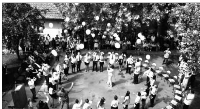
Újakra engedett léggömbök ilyenkor a búcsúzás, az elbocsátás jelképei