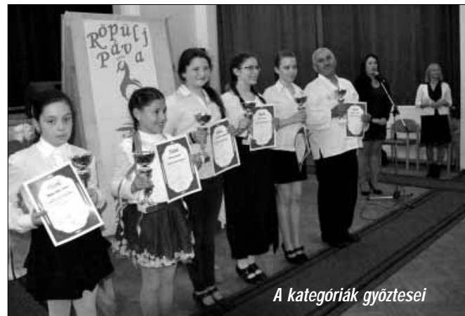
A kategóriák győztesei