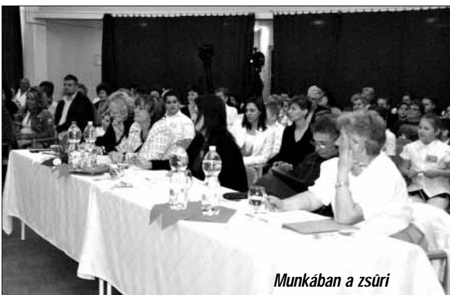
Munkában a zsűri