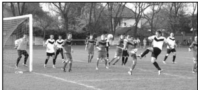
A 8. gól születése: a labda félúton (középen) a berényi kapu felé