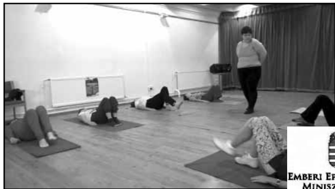
EMBERI ERŐFORRÁSOK MINISZTERIUMA