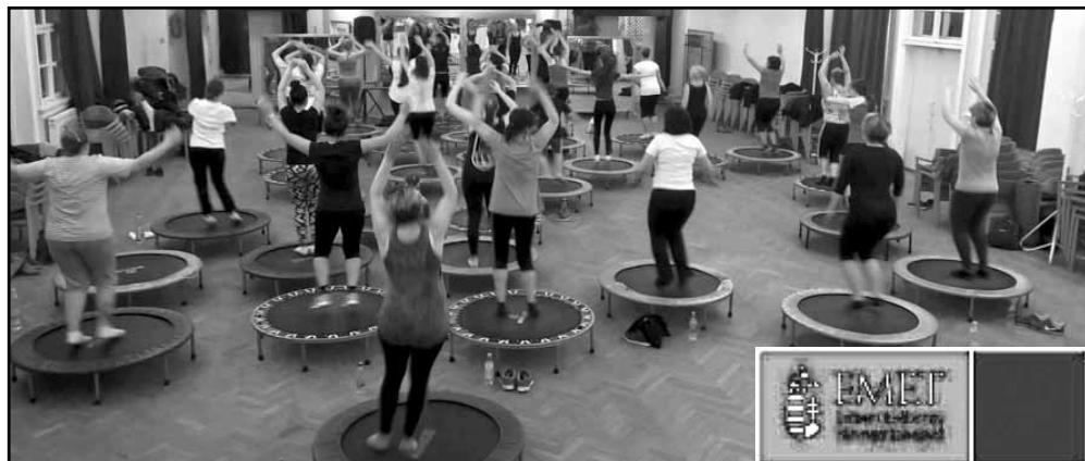
EMET Egészségünkért Munkaügyi Tanács

Egészségünkért Sport- és Kulturális Egyesület