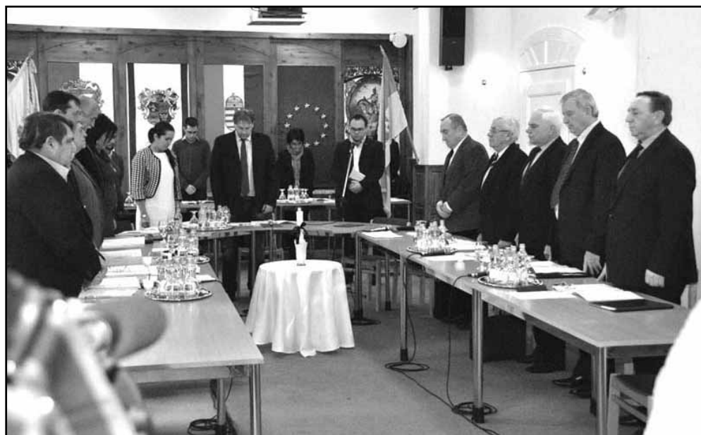
A megjelentek idén is fejet hajtottak a kommunizmus áldozatai előtt a kommunista diktatúra áldozatainak emléknapja alkalmából

Az idei költségvetés rövid elemzése kapcsán a polgármester arra is kitért, hogy az