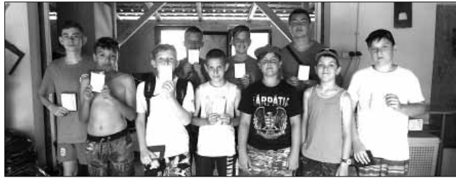
Akik horgászvizsga bizonyítványt szereztek