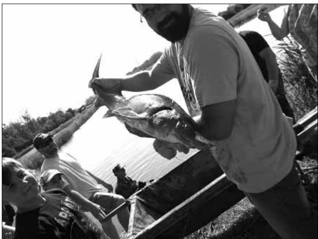
A Szarvason tett kiránduláson különleges halfajtaikat (tokféléket) is láttak