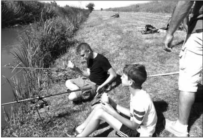
Horgászás a Bártók-csatornán

A Sarkadi Horgász Egyesület ismét megszervezte Horgász és szabadidős táborát, melyben 30 általános iskolás gyermek, 4 pedagógus és 6 felnőtt segítő vett részt. Jellemzően táborunkba nemcsak a horgászat iránt érdeklődő és azt művelő gyerekek érkeznek, ezért mindig készülünk más programmal is, hogy mindenki jól érezze magát.