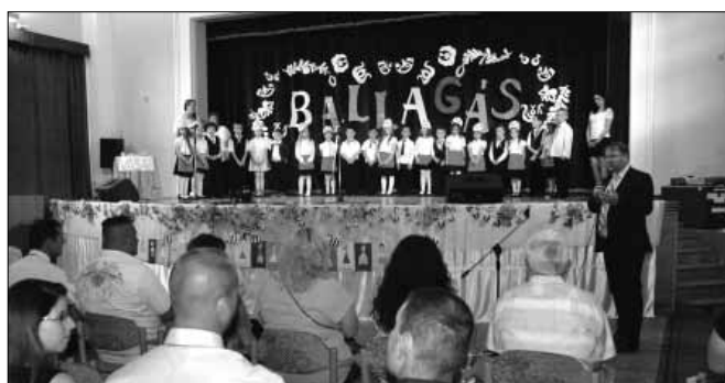
Ünnepségeinket megtisztelte jelenlétével dr. Mokán István polgármester, aki megosztotta vendégeinkkel ünnepi gondolatait

Ella néni jóvoltából felavattak az óvoda épületének falán egy kis emléktáblát, mely emlékeztet erre a 25 évre. Közös énekeltek a vendégek egy dalt, majd szülinapi torta elfogyasztása mellett mesélték el korábbi emlényeiket, tapasztalatikat az óvodáról.