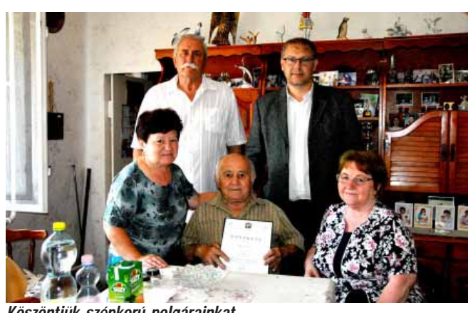
Köszöntjük szépkorú polgárainkat