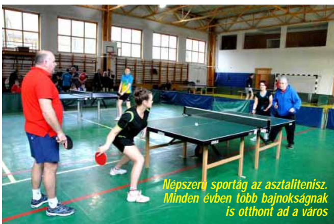
Népszerű sportág az asztalitenisz. Minden évben több bajnokságnak is otthont ad a város