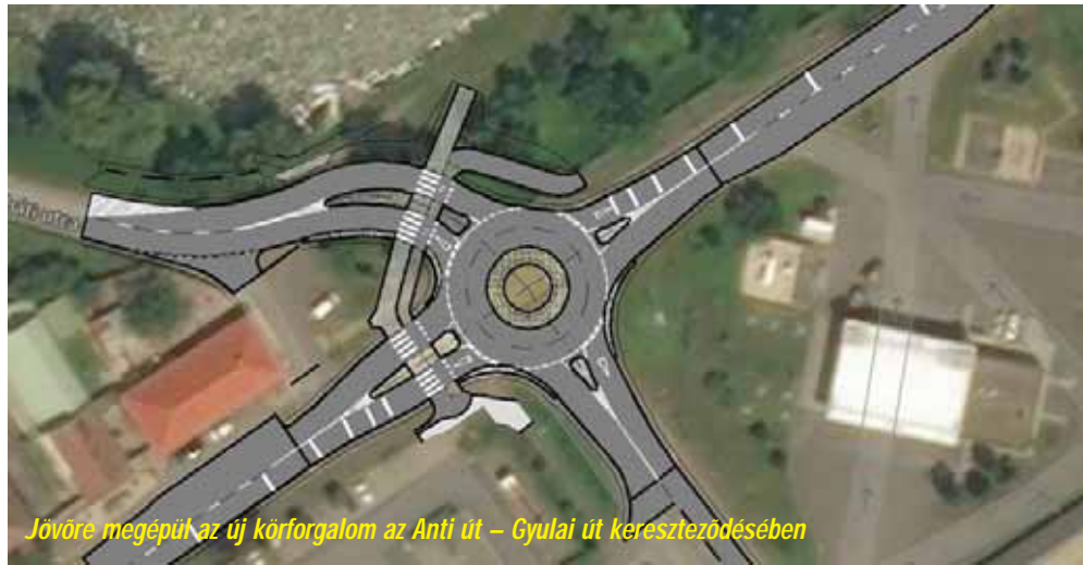
Jövőre megépül az új körforgalom az Anti út – Gyulai út kereszteződésében