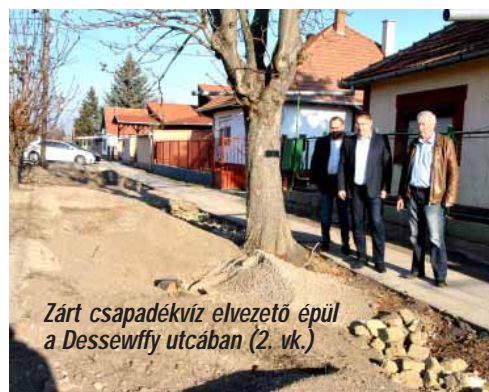
Zárt csapadékvíz elvezető épül a Dessewffy utcában (2. vk.)