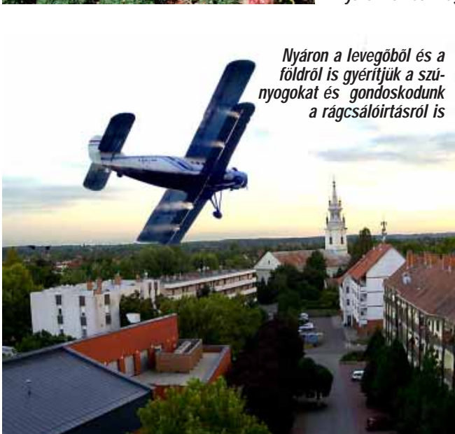
Nyáron a levegőből és a földről is gyérítjük a szünyogokat és gondoskodunk a rágcsálóirtásról is