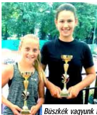
Büszkék vagyunk fiatal sportolóinkra