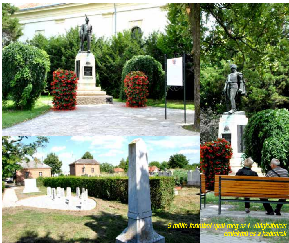
5 millió forintból újult meg az 1. világháborús emlékmű és a hadisírok