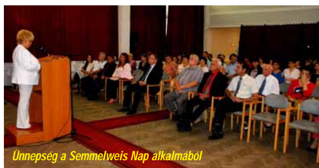
Ünnepség a Semmelweis Nap alkalmából