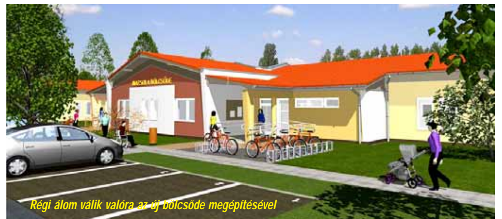
Régi alom válik valóra az új bölcsőde megépítésével

A középiskola diáksága már egy teljes energetikai korszerűsítésen átesett intézményben kezdhette meg az új tanévet. 250 millió forintból valósult meg az Ady Endre - Bay Zoltán Gimnázium és Kollégium főépületének, va- (folytatás a 3. oldalon)