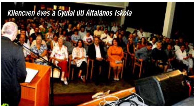
Kilencven éves a Gyulai úti Általános Iskola