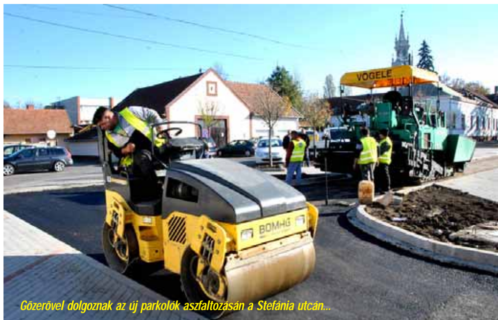
Gőzerővel dolgoznak az új parkolók aszfaltozásán a Stefánia utcán...