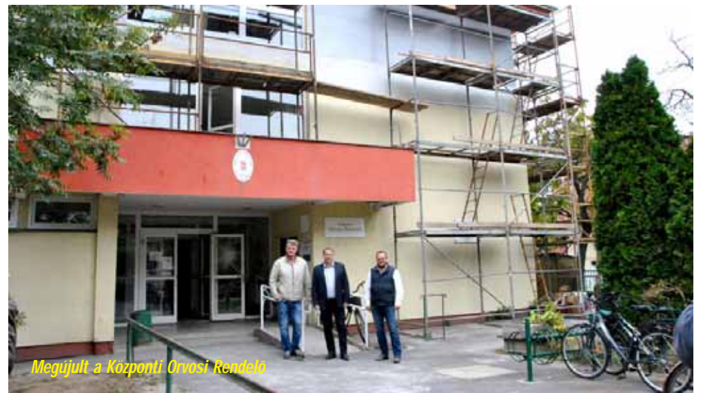
Megújult a Központi Orvosi Rendelő