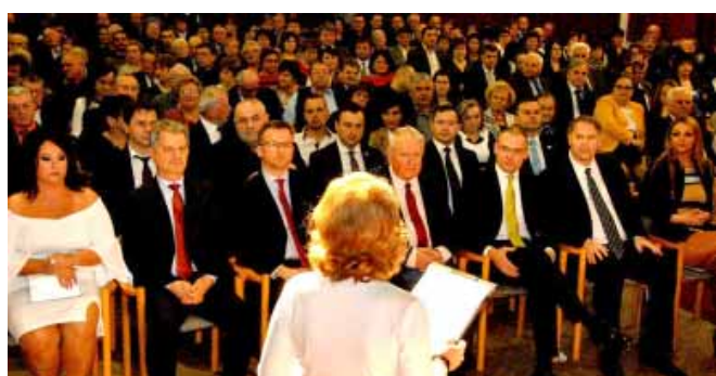
Az Újévi Önkormányzati Partnertalálkozón köszöntöttük önkormányzatunk legjelentősebb partnereit