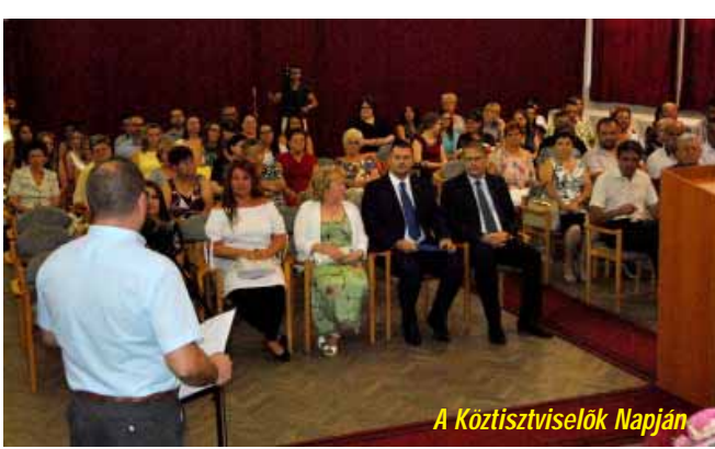
A Köztisztviselők Napján