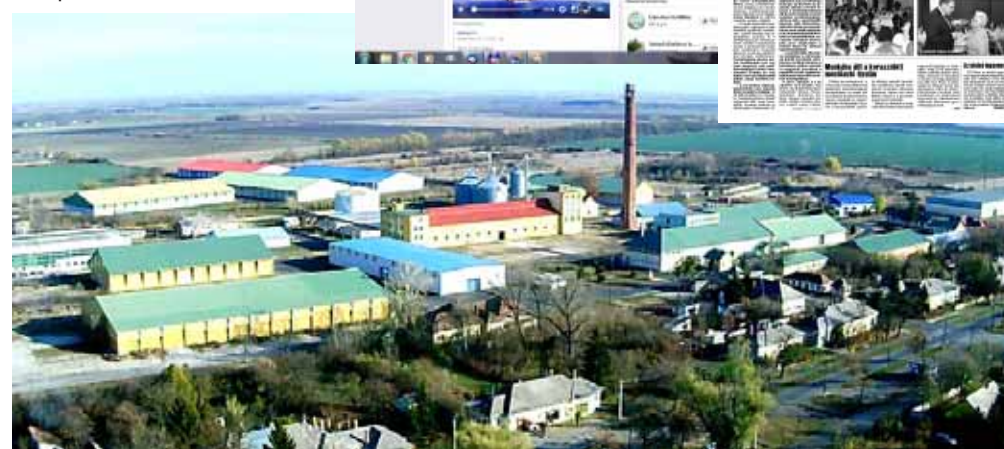
A tulajdonosok folyamatosan fejlesztik a Sarkadi Ipari Parkot, a Cereal Kft. a gabonakereskedelem és raktározás mellett újraindította az olajüzemet is, ami új munkahelyeket és adóbevételt jelent

Sarkad Város Önkormányzata - beleértve a közfoglalkoztatottak körét is - közel ezer főt foglalkoztat és a folyamatban levő önkormányzati beruházások, megrendelések, beszerzések szintén munkát, megélhetést biztosítanak sok helyi vállalkozónak, valamint az általuk foglalkoztatott sarkadi lakosoknak is. Mindemellett a városvezetés lehetőségeinek keretei között elkötelezetten támogatja a munkahelyteremtést célzó vállalkozói és civil szervezeti kezdeményezéseket, elképzeléseket.