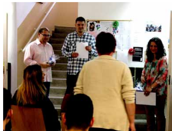
A Gyulai Szakképzési Centrum Ady Endre - Bay Zoltán Szakgimnáziumában minden esztendőben csatlakoznak a „Szakmák Ejszakája” című programsorozathoz. Az érdeklődők kipróbálhatják a Sarkadon oktatott szakmákat

A város vezetése elkötelezett az intézmények folyamatos fejlesztése iránt, ezért pályázat került benyújtásra többek között az óvodák, az általános iskolák, a városi piac, a Központi Orvosi Rendelő, a képtár és az Éden Camp további fejlesztésére is.