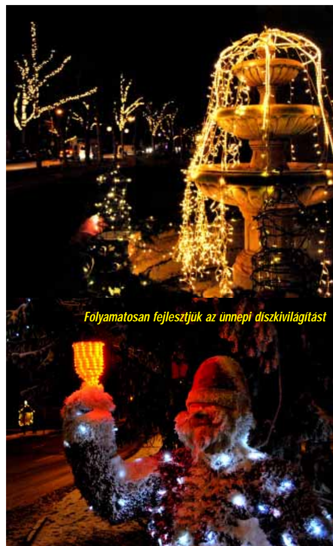
Folyamatosan fejlesztjük az ünnepi díszvilágítást