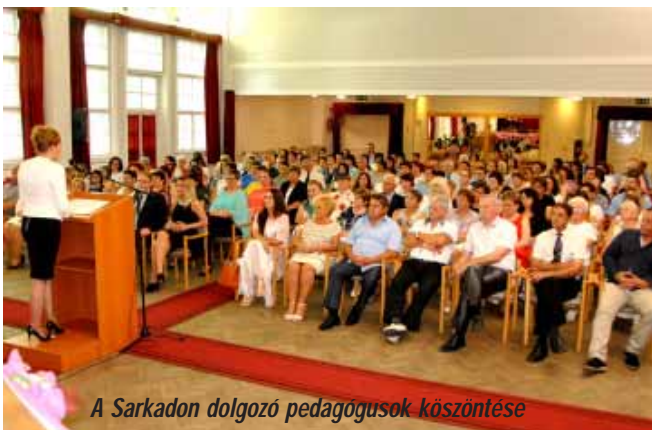
A Sarkadon dolgozó pedagógusok köszöntése