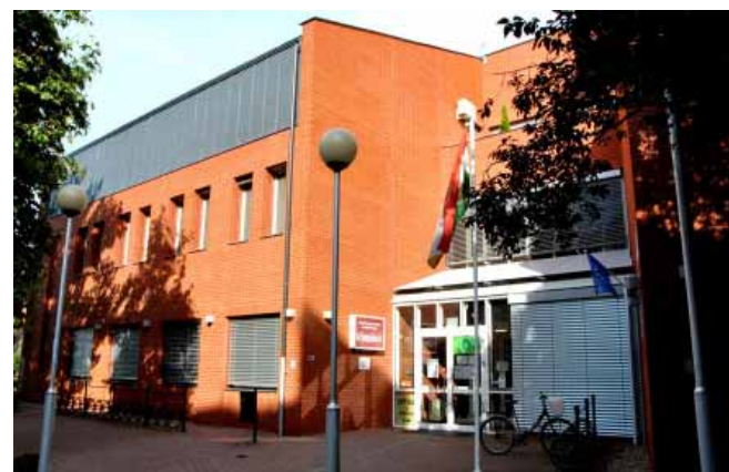
A Kistérségi Járóbeteg Szakellátó Központ a Sarkadi Járás közel 23 ezer lakosának nyújt korszerű, magas szakmai színvonalú egészségügyi ellátást