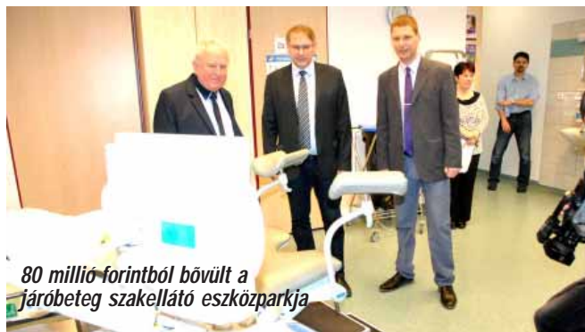
80 millió forintból bővült a járóbeteg szakellátó eszközparkja

Végighaladva Sarkadon örömmel nyugtázzhatjuk, hogy a 2018-as esztendő ténylegesen a beruházások éve városunkban. Továbbá az is látható, hogy a nagy ívű fejlesztések az idén nem érnek véget, az építkezések, beruházások jövőre is folytatódnak. A tavalyi lapszámában számos megnyert önkormányzati pályázatról számoltunk be, most örömmel mutatjuk be a megvalósításról tanúszkodó képeket.