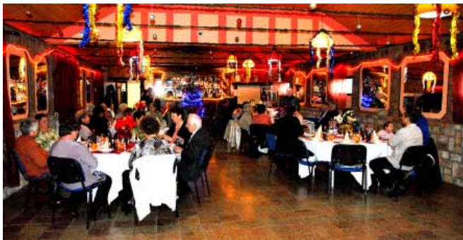
A Cukorbetegség Sarkadi Egyesülete sok sorstársuknak nyújt segítséget, mint ahogy a Mozgáskorlátozottak Dél-Alföldi Regionális Egyesületének Sarkadi Csoportja is.