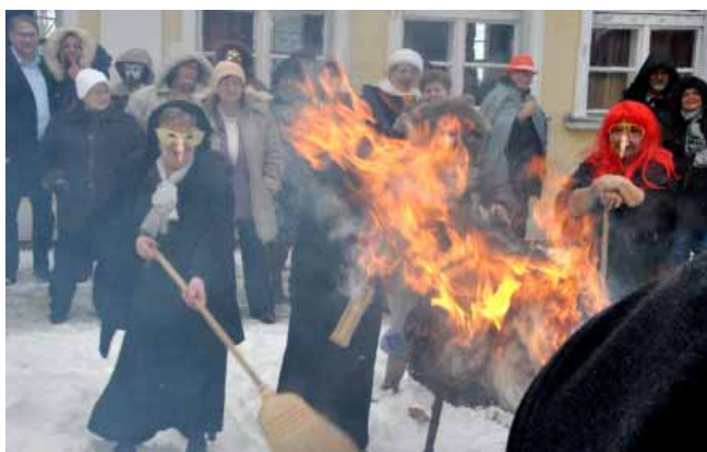
Úzi a telet az ÁFÉSZ Nyugdíjas Egyesület tagsága