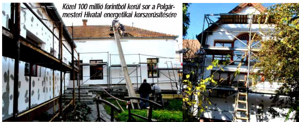
Közel 100 millió forintból kerül sor a Polgármesteri Hivatal energetikai korszerűsítésére