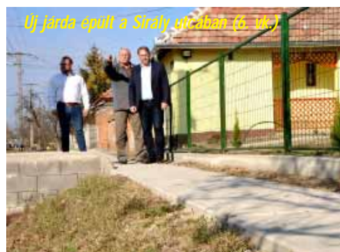
Új járda épült a Sírly utcában (6. vk.)