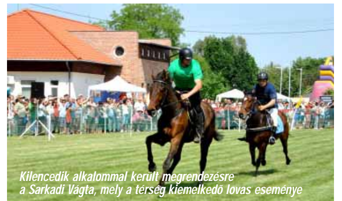
Kilencedik alkalommal került megrendezésre a Sarkadi Vágta, mely a térség kiemelkedő lovas eseménye