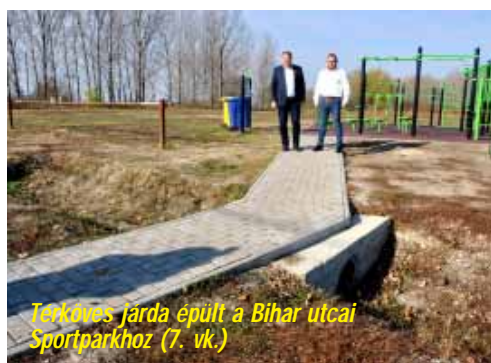
Térköves járda épült a Bihar utcai Sportparkhoz (7. vk.)