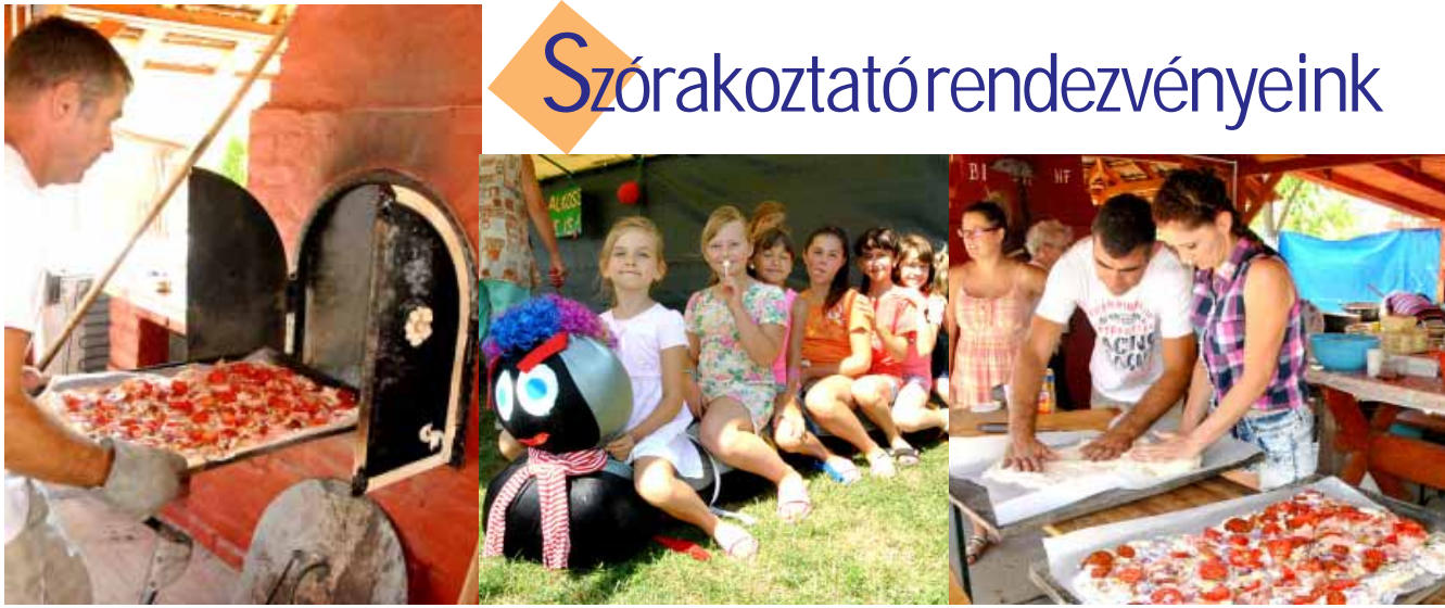
Gasztronómiai fesztivállá nő a folyamatosan fejlődő, épülő - szépülő Kálvin téren megrendezett, immáron VII. Teleki Családi Nap. Az Újteleken ilyenkor sport- és zenés programokkal is várják az érdeklődő sarkadiakat