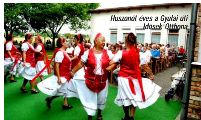
Huszonöt éves a Gyulai úti Idősek Otthona