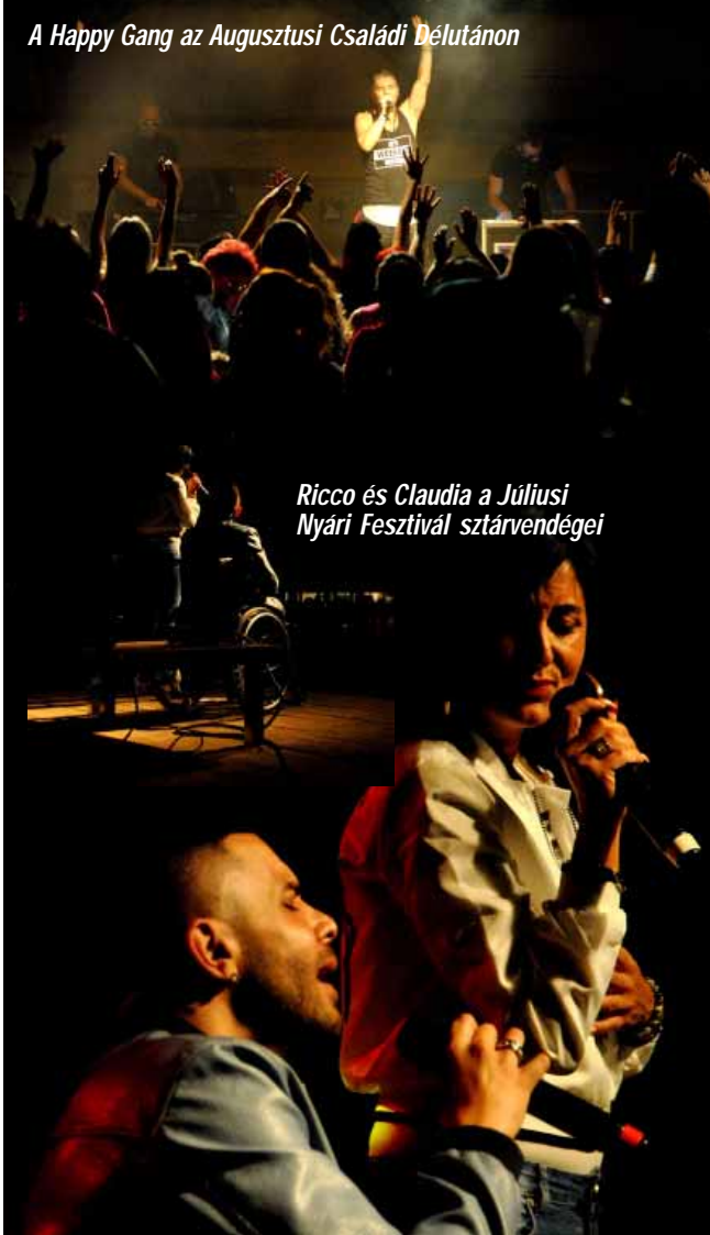
A Happy Gang az Augusztusi Családi Délutánon