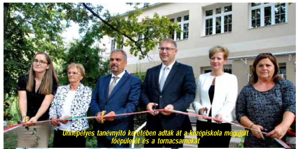
Unnepelyes tanévnyitó keretében adták át a középiskola megújult főépületét és a tornacsarnokát