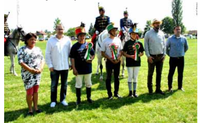
A Sarkadi Vágta továbbjutói