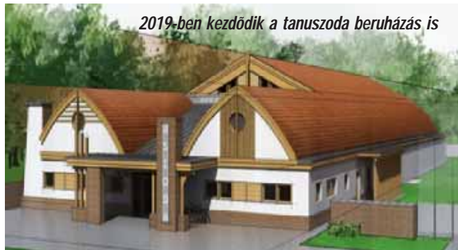
2019-ben kezdődik a tanuszoda beruházás is