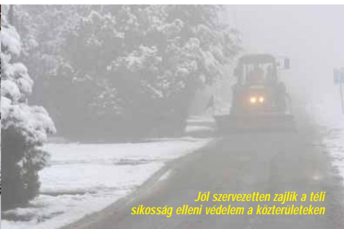
Jól szervezettel zajlik a téli síkosság elleni védelem a közterületeken