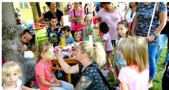
Idén is sok kisgyermek szórakozott a Városi Gyermeknapon