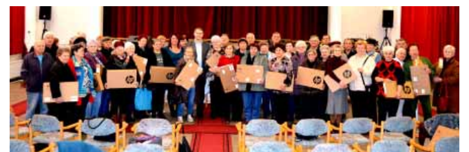
Hetvenöt egyedül élő, 65 év feletti sarkadi nyugdíjasnak nyújt segítséget az Idősügyi Infokommunikációs Program