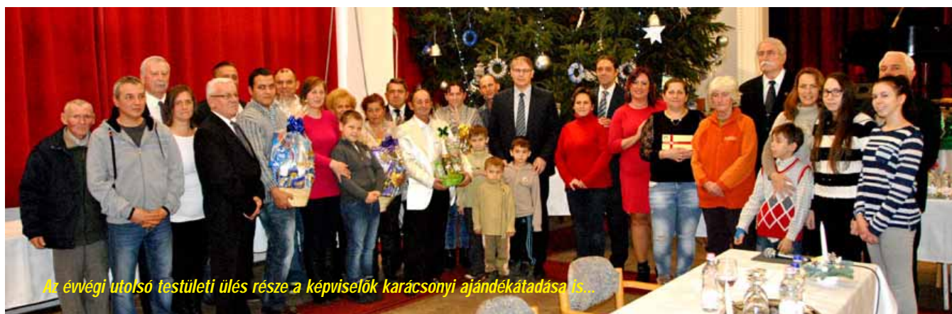
Az év végi utolsó testületi ülés része a képviselők karácsonyi ajándékátadása is.