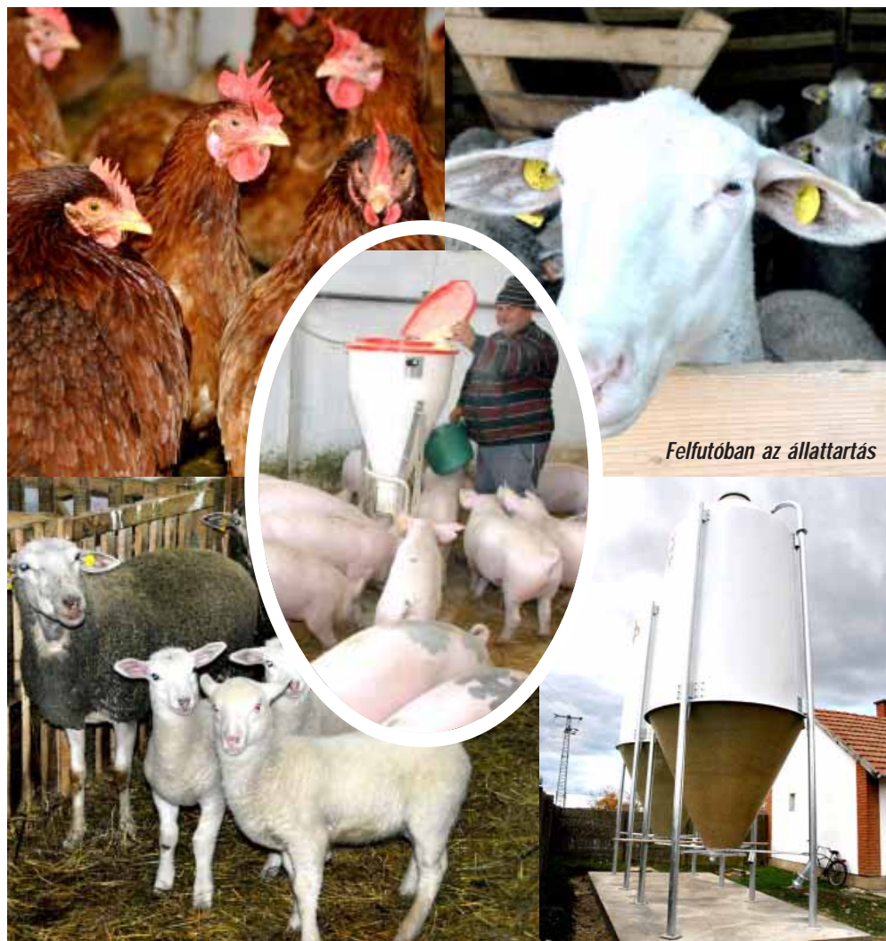
Felfutóban az állattartás