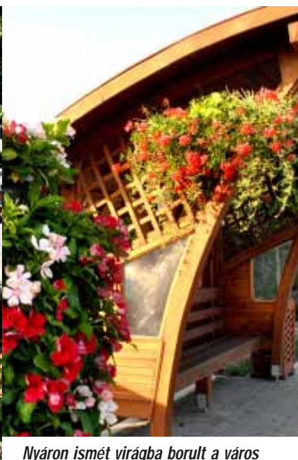
Nyáron ismét virágba borult a város