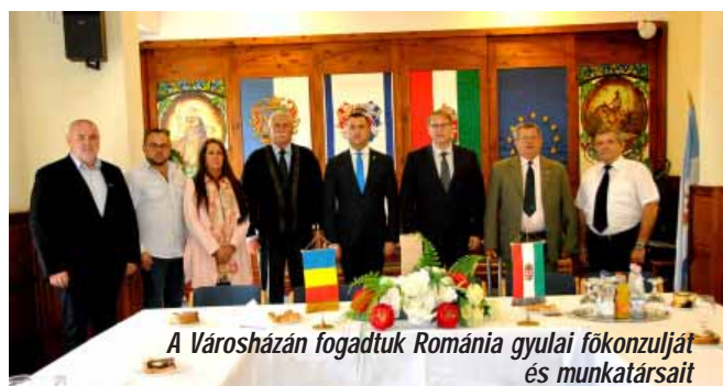
A Városházán fogadtuk Románia gyulai főkonzultját és munkatársait