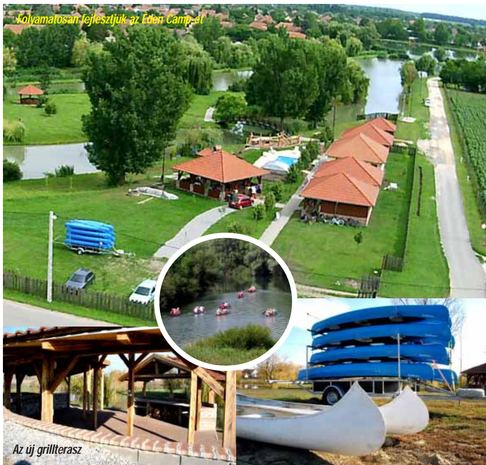
Kölyematosan fejlesztjük az Eden Camp-et