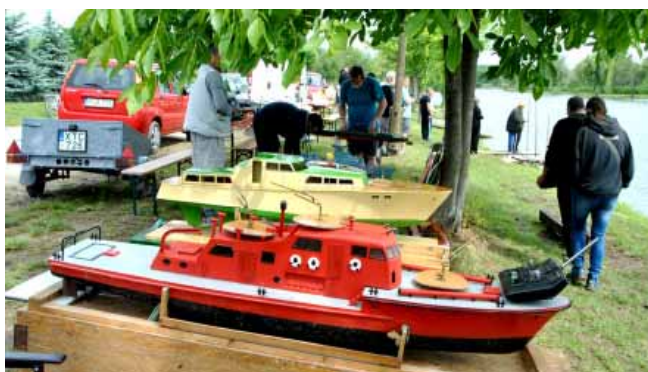
Tizedik alkalommal rendezték meg az Éden-tó vizén az Éden-tó Kupa Nemzetközi Hajómodellező Versenyt