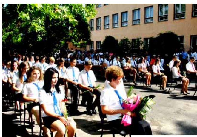
Ballagások az általános iskolákban és az óvodákban