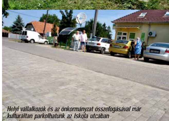
Helyi vállalkozók és az önkormányzat összefogásával már kulturáltan parkolhatunk az Iskola utcában

terasszal gazdagodott a létesítmény, tovább növelve az itt megszállók, pihenők komfortját. A tavasszal elindult újabb „Gyermekesély Program”, valamint a „Humán közszolgáltatások fejlesztése” program 1 milliárd forintos forrással segíti elő a Sarkadi Kistérség felzárkóztatását.