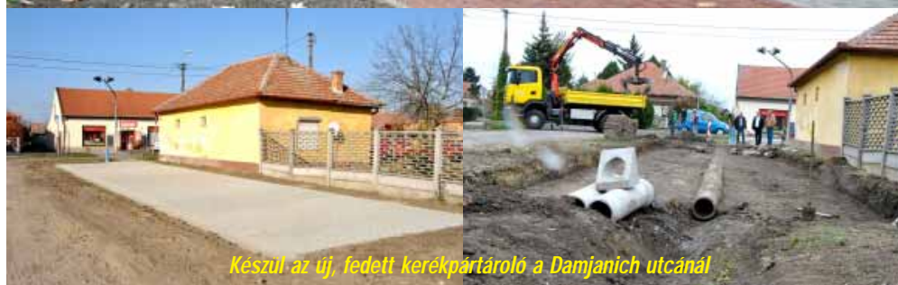
Készül az új, fedett kerékpártároló a Damjanich utcánál