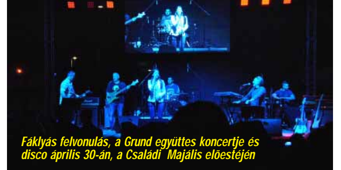
Fáktyás felvonulás, a Grund együttes koncertje és disco április 30-án, a Családi Majális előestéjén