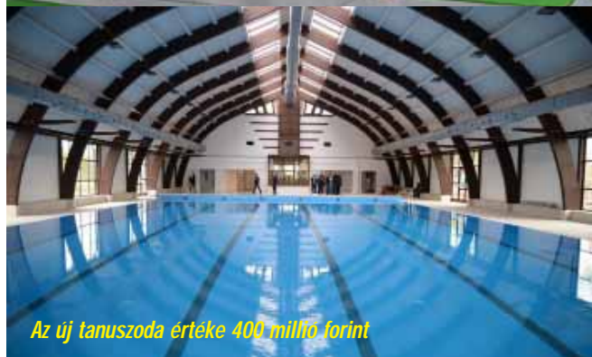
Az új tanuszoda értéke 400 millió forint