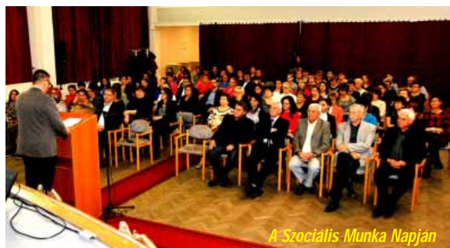
A Szociális Munka Napján