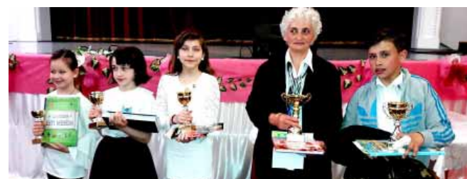
Az „Év Hangja a Sarkadi Kistérségben” első helyezettjei