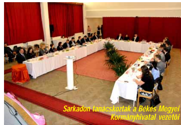
Sarkadon tanácskoztak a Békés Megyei Kormányhivatal vezetői