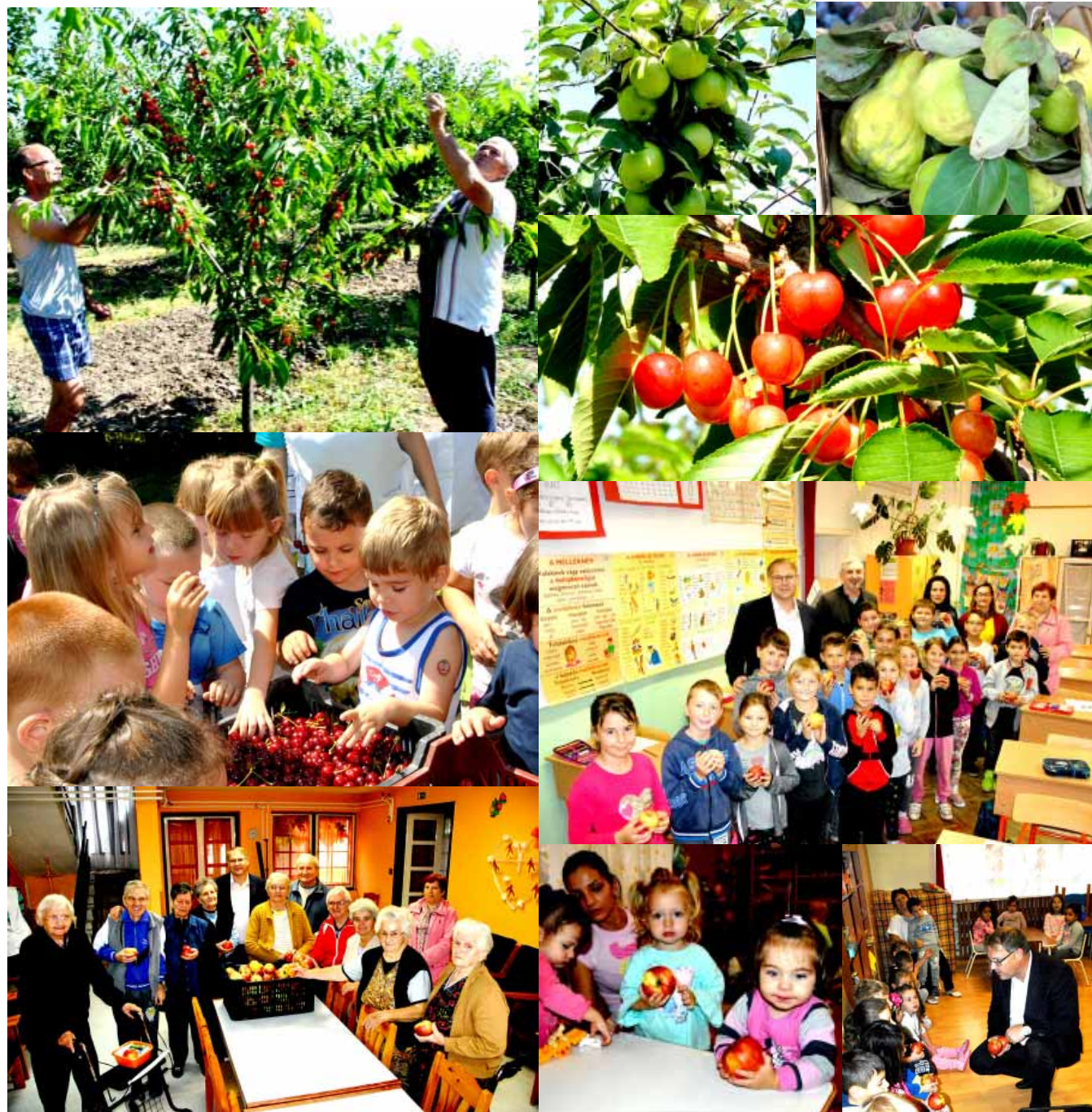
A gyermekek és az idősek örömmel fogadták az önkormányzat Epreskert utcai kertjében termelt gyümölcsöket