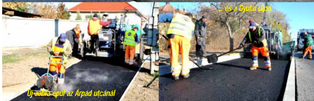
...és a Gyulai úton