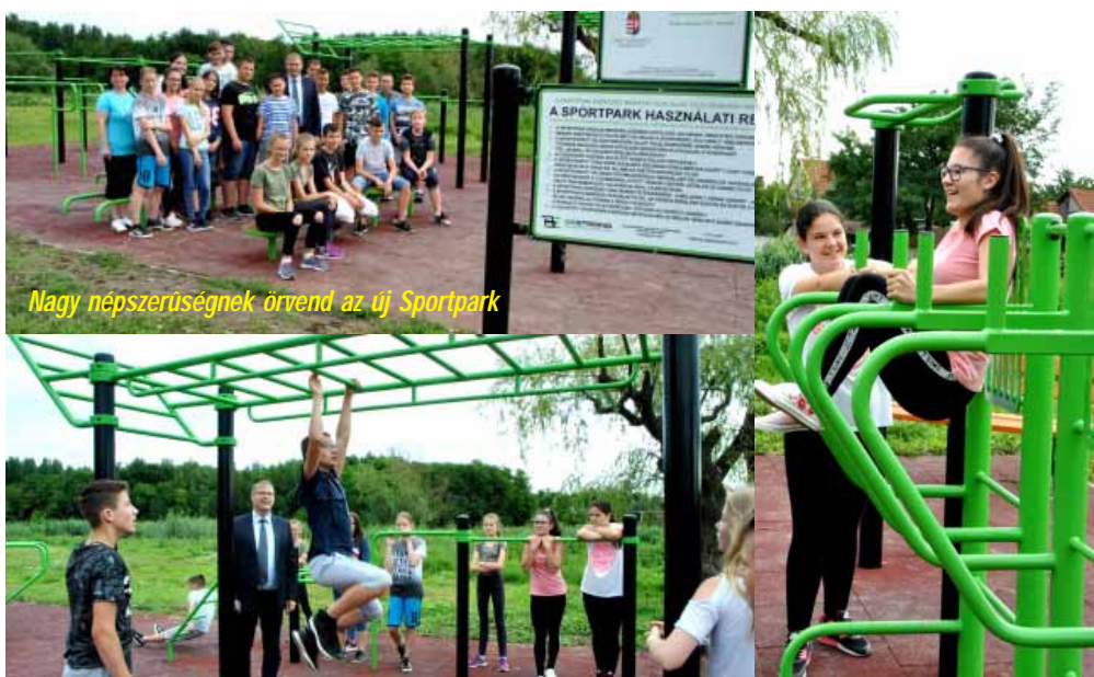
Nagy népszerűségnek örvend az új Sportpark

terasszal gazdagodott a létesítmény, tovább növelve az itt megszállók, pihenők komfortját. A tavasszal elindult újabb „Gyermekesély Program”, valamint a „Humán közszolgáltatások fejlesztése” program 1 milliárd forintos forrással segíti elő a Sarkadi Kistérség felzárkóztatását.