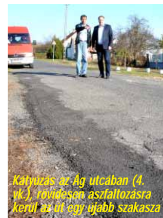
Kátyuzas az Ág utcában (4. vk.), rövidesen aszfaltozásra kerül az út egy újabb szakasza

elvégzése. Kommunális feladatok alatt fő szabály szerint utak, járdák építése, létesítése, felújítása, csapadék- és belvízelvezető árok rendbetétele, közterületek