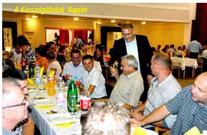
A Köszolgáltatók Napján