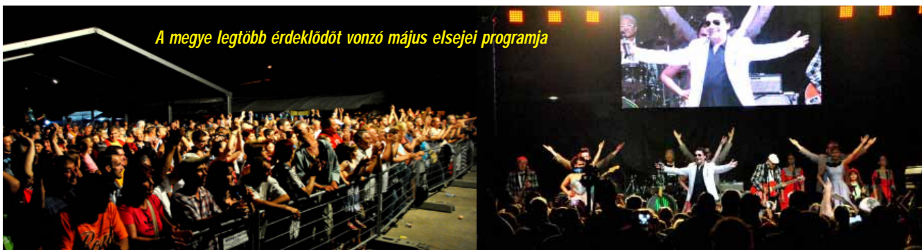
A megye legtöbb érdeklődőt vonzó május elsejei programja