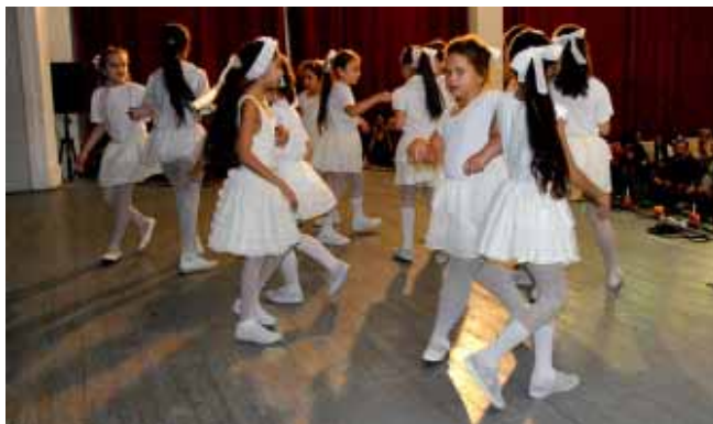
A „Leg a láb” Alapfokú Művészeti Iskola sarkadi növendékei