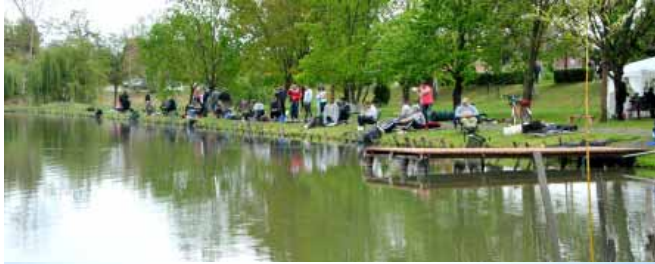
Számos horgász és halász versenyt rendeznek az Éden-tavakon