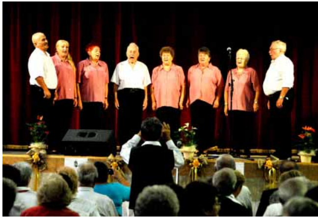
A XII. Dalos Találkozót szervezte meg a Sarkadi Nyugdíjasok Érdekvédelmi Egyesülete, a határon túlról is érkeztek énekesek

Sarkadon nagy hagyománya van a civil szervezetek működésének, amit több millió forintos támogatással segít minden évben az önkormányzat is. A sportélet szintén élénk a városban, amit igyekszik lehetőségeihez mérten támogatni a városvezetés is. Különösen büszkék vagyunk a tehetséges, fiatal sportolóinkra, akik a jövő sportéletének meghatározó alakjai lehetnek.