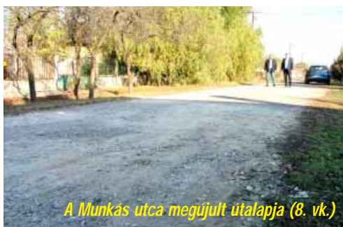
A Munkás utca megújult útalapja (8. vk.)