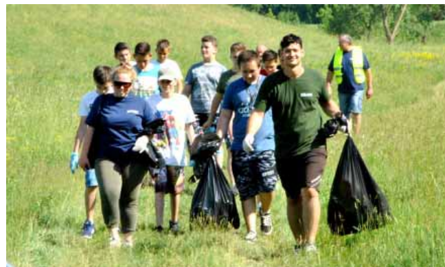
A Környezetért Egészségért Sportért Egyesület rendszeres szervezője városunkban az országos Te Szedd akciónak