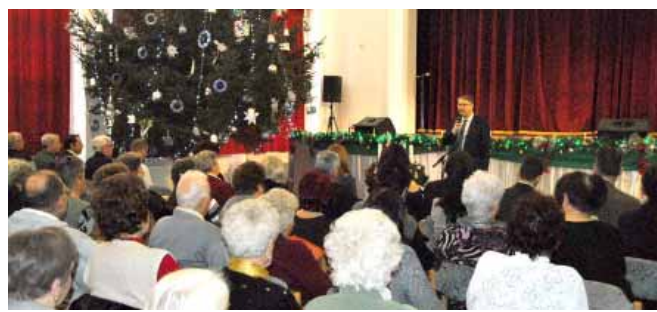
Mindig teltházas esemény a művelődési házban az Idősek Karácsonya