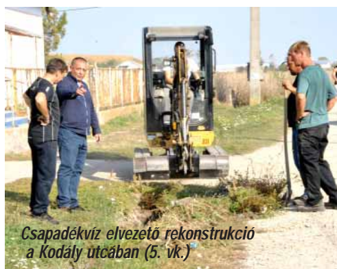
Csapadékvíz elvezető rekonstrukció a Kodály utcában (5. vk.)