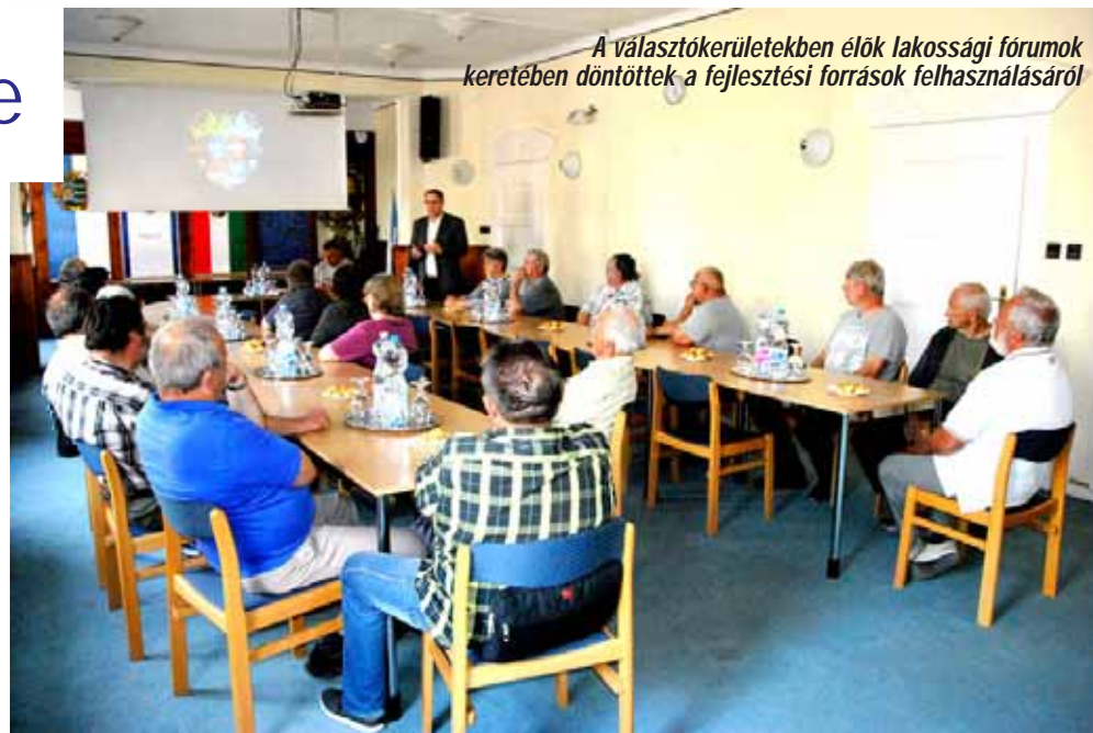
A választókerületekben élők lakossági fórumok keretében döntöttek a fejlesztési források felhasználásáról

Sarkad Város Önkormányzatának Képviselő-testülete az önkormányzati alap- és önként vállalt feladatok ellátására választókerületenként pénzügyi alapot hozott létre, melynek fedezete az önkormányzat éves költségvetésében e célra elkülönített pénzeszköz. Ennek mértéke minden évben külön kerül meghatározásra, a 2018. évre vonatkozóan választókerületenként 1,5 millió forintot tesz ki.