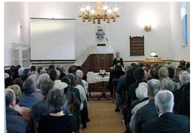
Az Újteleki Református Egyházközség önállóvá válásának 70. évfordulóját ünnepeltük