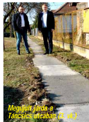
Megújult járda a Tancsics utcában (3. vk.)

Az alap rendeltetése az adott választókerületben meglévő kommunális feladatok - az éves keret szintjéig azonos színvonalon való - megoldása, a közterülethez kapcsolódó fejlesztési, felújítási, karbantartási munkák