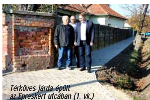
Térköves járda épült az Egreskert utcában (1. vk.)