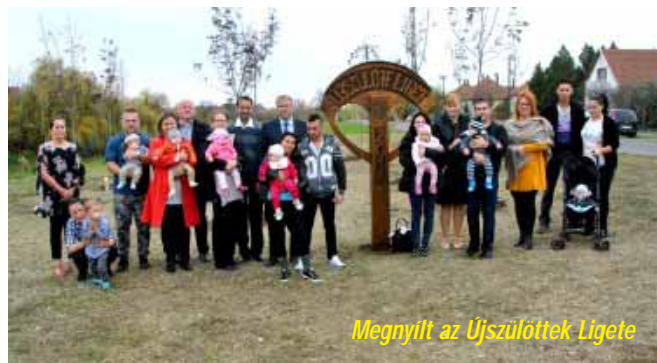
Megnyílt az Újszülöttek Ligete