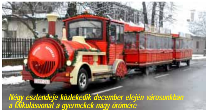
Négy esztendeje közlekedik december elején városunkban a Mikulásvonat a gyermekek nagy öröme

da is a hatáskörükbe tartozik. A városüzemeltetés részét képezi az önkormányzati intézmények és az ingatlanállomány kezelése, a város kiterjedt csapadékvíz elvezető hálózatának folyamatos fejlesztése, az utalpok karbantartása, a szilárd burkolatú utak kátyúzása, a közterületek gondozása, virágosítása és a téli síkosság elleni védelme is. Ezekben a városüzemeltetéshez kapcsolódó munkákban nagy segítséget jelent a közmunkaprogram.