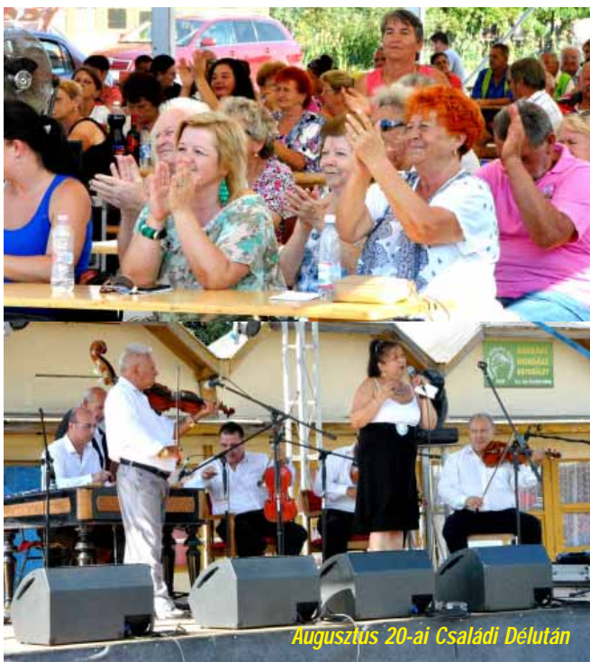
Augusztus 20-ai Családi Délután