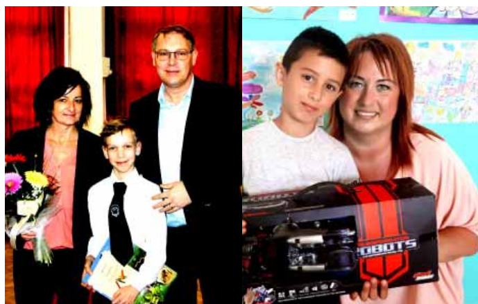
A Sarkadon megrendezésre kerülő mese- és matematika versenyek évről évre sok diákot vonzanak a megye iskoláiból