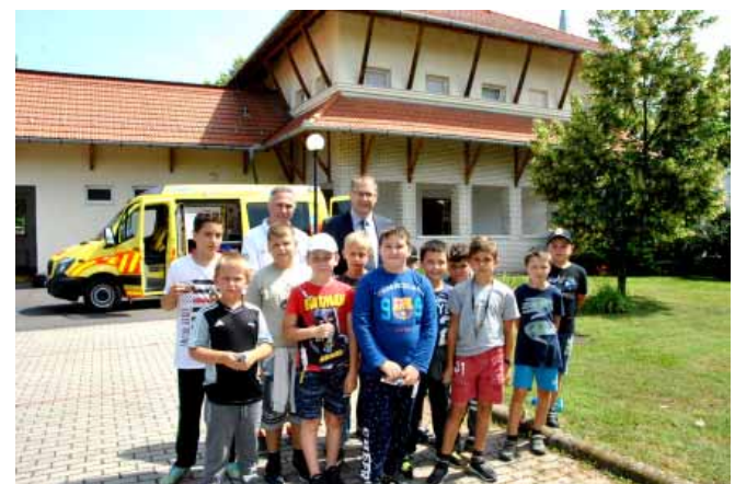
A helyi mentőállomáson a legkisebbek ismerkednek az eszközökkel a Mentők Napja alkalmából