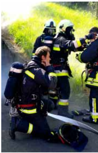
Már negyedik éve önállóan is beavathozhatnak a sarkadi önkéntes tűzoltók

Sarkadon nagy hagyománya van a civil szervezetek működésének, amit több millió forintos támogatással segít minden évben az önkormányzat is. A sportélet szintén élénk a városban, amit igyekszik lehetőségeihez mérten támogatni a városvezetés is. Különösen büszkék vagyunk a tehetséges, fiatal sportolóinkra, akik a jövő sportéletének meghatározó alakjai lehetnek.