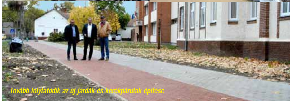
Tovább folytatódik az új járdák és kerékpárutak építése