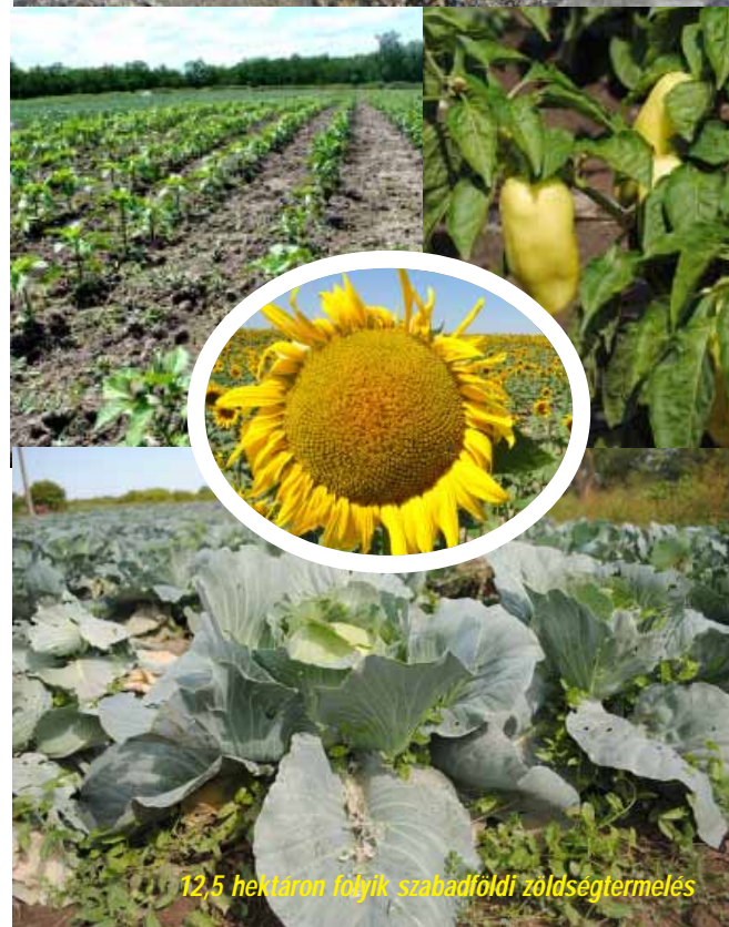
12,5 hektáron folyik szabadföldi zöldségtermelés