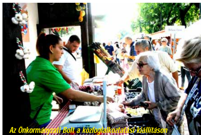
Az Önkormányzati Bolt a közfoglalkoztatási kiállításon