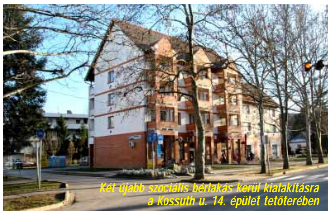
Két újabb szociális bérkas kerül kialakításra a Kossuth u. 14. épület tetőterében