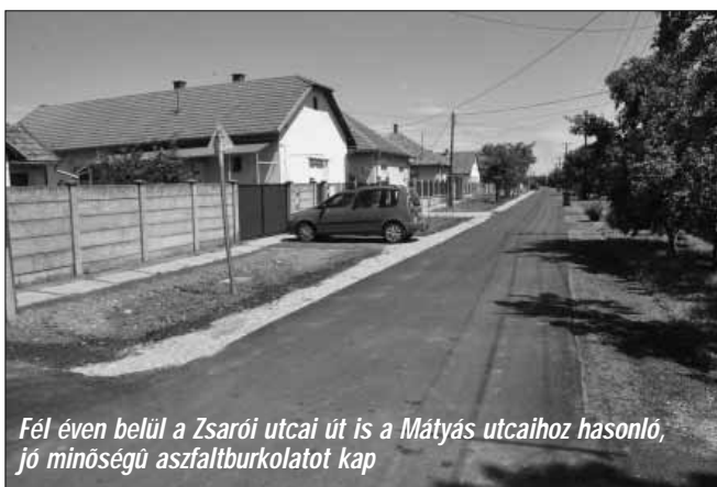
Fél éven belül a Zsarói utcai út is a Mátyás utcaihoz hasonló, jó minőségű aszfaltburkolatot kap