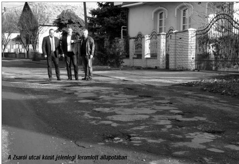
A Zsarói utcai közút jelenlegi leromlott állapotában

Emellett nagyon ritkán kiírásra kerülnek olyan pályázatok is, melyek elsődleges célja nem az önkormányzati utak építése és felújítása, de indokolt esetben, igen szigorú feltételek mellett lehető-