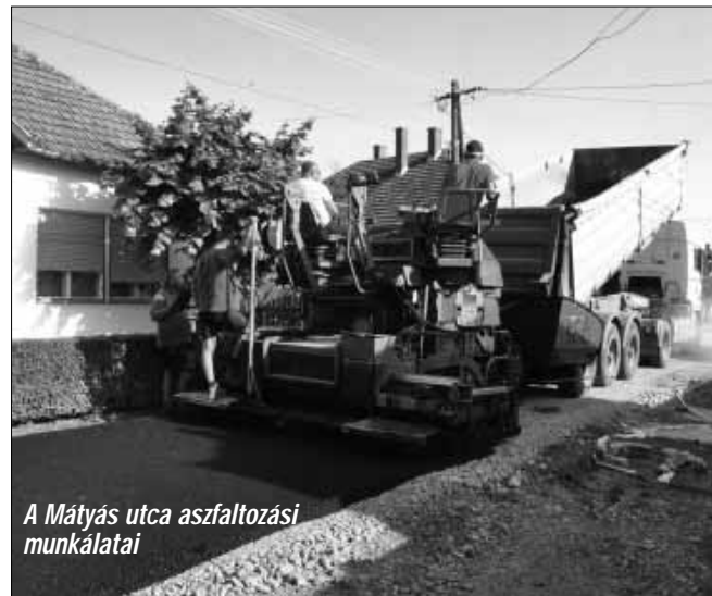
A Mátyás utca aszfaltozási munkálatai

A település lakosságának szolgálatában a fentiek mentén 2019. májusában Sarkad Város Önkormányzata pályázatot nyújtott be a Belügyminisztérium által meghirdetett „Önkormányzati feladatellátást szolgáló fejlesztések támogatása” elnevezésű pályázati felhívásra, a város egyik legforgalmasabb, gyűjtőút funkciót is ellátó és igen leromlott állapotban lévő önkormányzati lakóútjának, nevezetesen a Zsarói utcai aszfaltburkolatú közút felújítását célozva.