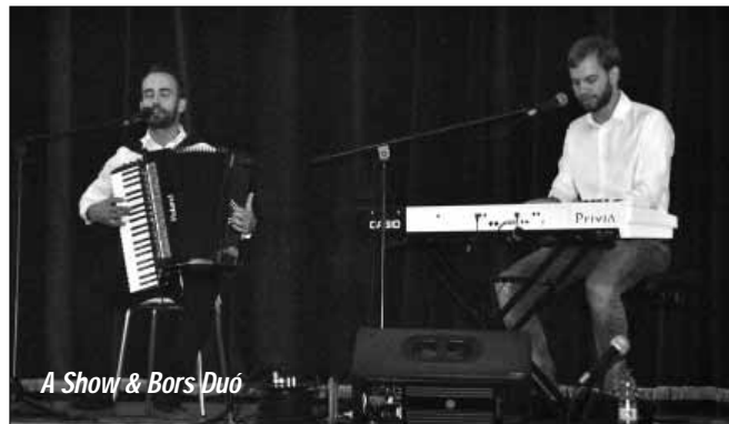
A Show & Bors Duo