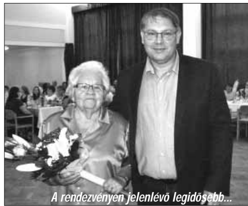
A rendezvényen jelenlévő legidősebb...