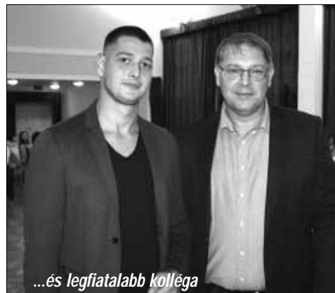
...és legfiatalabb kolléga