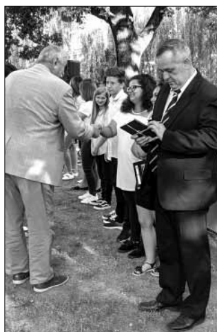
A középiskoláink ényitója

Hétfő reggel az Ady Endre - Bay Zoltán Gimnázium és Kollégium is megtartotta tanévnyitó ünnepségét a GySzC Ady Endre - Bay Zoltán Szakgimnázium és Szakközépiskolával közösen. Molnár