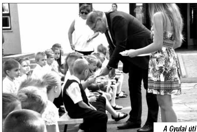
A Gyulai úti iskola ényitója