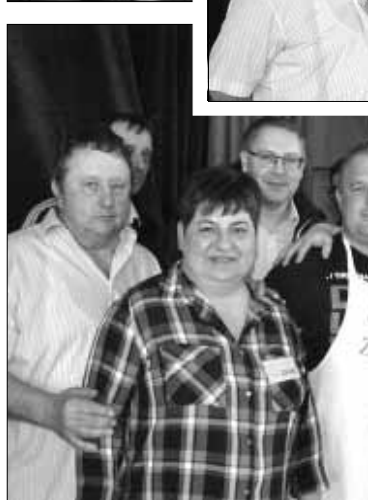
A kolbásztöltők győztesei (ketten jobbról) és a zsűri