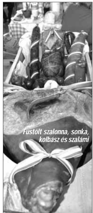
Füstölt szalonna, sonka, kolbász és szalámi