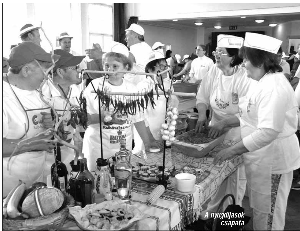
A nyugdíjasok csapata

Természetesen a program szervezői nem csak egy hagyományos kolbászkészítő versenyben gondolkodtak, hanem helyi szárazkolbász versenyre és pálinkamustrára is sor került. Így többen versenyre bocsátották az általuk, hagyományos családi receptek alapján készített vastag és vékony szárazkol-