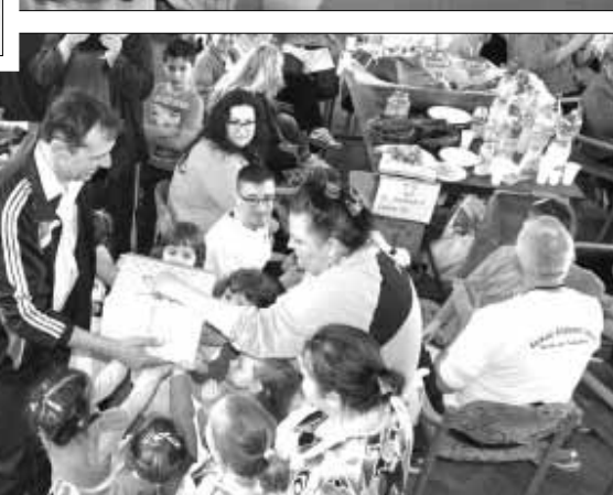
A csokitortát – különdíjat – átvevő óvodások