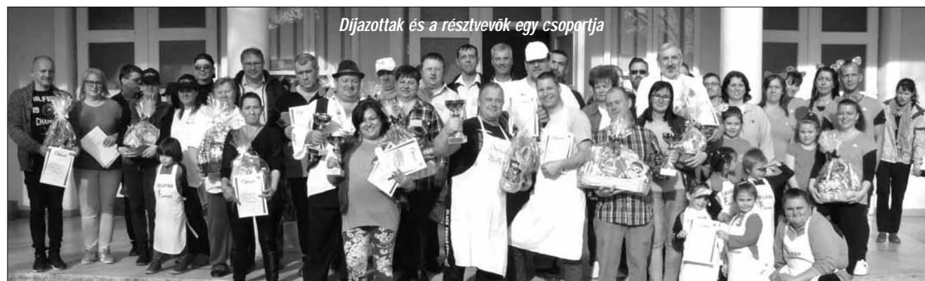
Díjazottak és a résztvevők egy csoportja