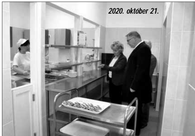
2020. október 21.