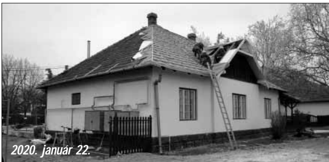
2020. január 22.