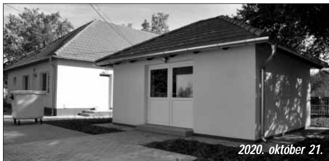
2020. október 21.