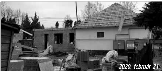
2020. február 21.