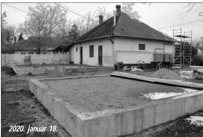
2020. január 18.