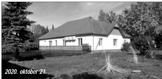
2020. október 21.