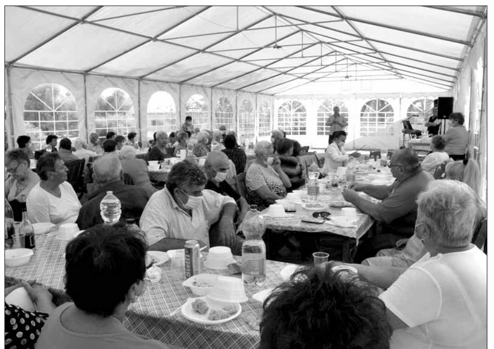
Dr. Mokán István polgármester a rendezvényeken személyesen köszöntötte a megjelenteket

A TOP-7.1.1-es pályázati programnak köszönhetően az elmúlt héten szerdán a Sarkadi Nyugdíjasok Érdekvédelmi Egyesülete, csütörtökön pedig a Sarkad és Vidéke ÁFESZ Nyugdíjas Egyesülete szervezte meg egész napos közösségi rendezvényét az Eden Camp-ben „Sarkad kultúrában is egységben” címmel (projekt azonosítószám: TOP-7.1.1-16-H-ESZA-2019-00517).