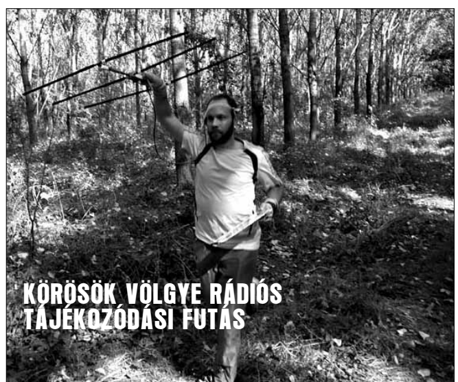
KÖRÖSÖK VÖLGYE RÁDIÓS TÁJÉKOZÓDÁSI FUTÁS

Gyula Városerdőn, az Erdei Iskolában, szeptember 11-13-án, rendeztük meg a III. Körösök Völgye Rádiós Tájékozdási Futóversenyt (RTF) és edzőtábort.