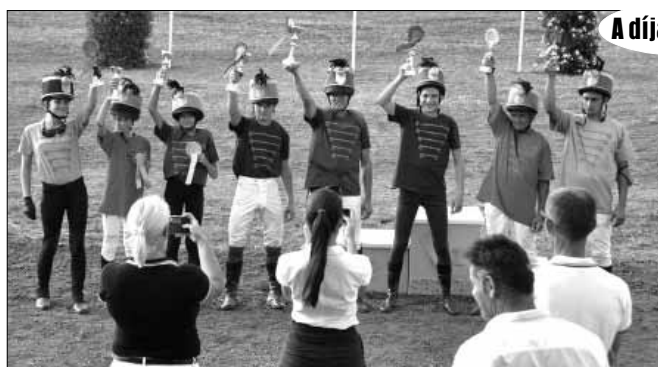
A díjak átadása