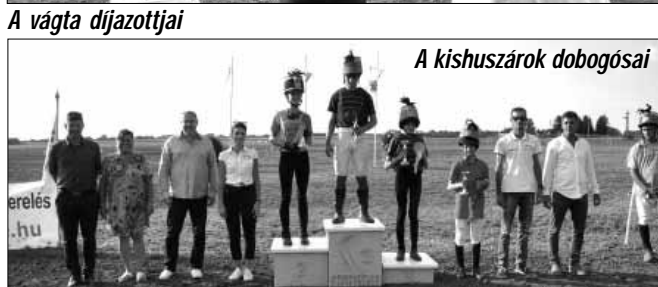
A kishuszárók dobogósai