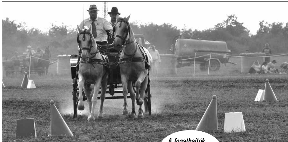
A fogathajtó verseny kezdete és a kocsik közlése