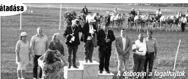
A dobogós a fogathajtó verseny után