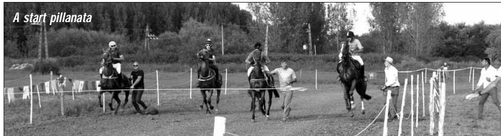
A start pillanata