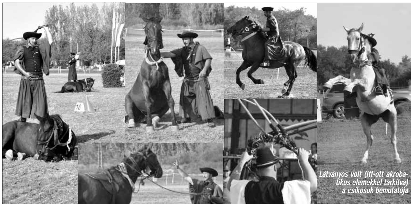
Látványos volt (itt-ott akrobáikus elemekkel tarkítva) a csikósok bemutatója