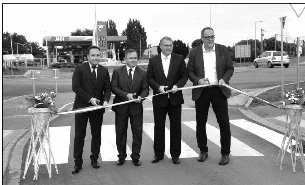
Az avatószalag átvágásának pillanata

A polgármester elmondta, hogy az elmúlt években egy hozzávetőleg 10 milliárd forint értékű beruházáscsomag megvalósítása kezdődött meg a városban. Ennek a csomagnak az eleme az új körforgalom, illetve az új szökőkút is, de egy sor beruházás átadása még hátra van, illetve vannak olyanok is, mint például az új tanuszoda, vagy a városi tornacsarnok megépítése, melyek megvalósítása a napokban kezdődik el. Az átadásra kerülő körforgalom kapcsán elhangzott, hogy a munkálato- kat a Magyar Közút Nonprofit Zrt. koordinálta, azok 2019 őszén indultak és az idei év nyarán értek véget, s már hetek óta használhatják a közlekedők Sarkad egyik legnagyobb közlekedésfejlesztés-