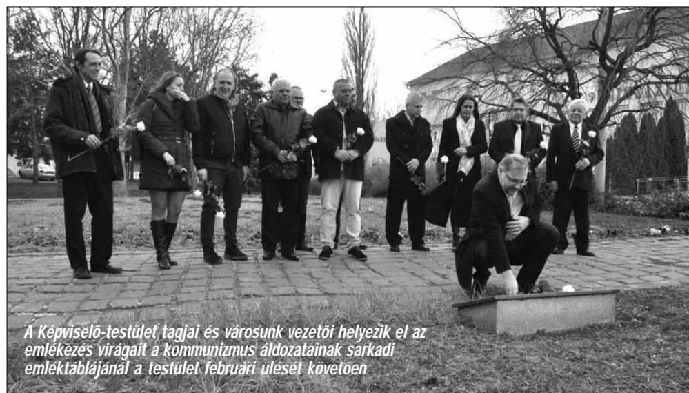
A Képviselő-testület tagjai és városunk vezetői helyezik el az emlékezés virágait a kommunizmus áldozatainak sarkadi emléktáblájánál a testület februári ülését követően

Azonban nem csak ők voltak a kommunizmus áldozatai. Mihail Gorbacsov, akinek a hidegháború végét és a békés leszerelést köszönhetjük, aki műveltségének és intelligenciájának köszönhetően megérett az idők szavát, Ő maga 27 millióra tette a kommunizmus szovjetunióbeli áldozatainak számát.