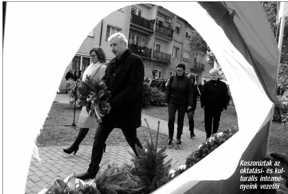
Koszorúztak az oktatási- és kulturális intézményeink vezetői

Sarkadon hála Istennek nem voltak véres utcai harcok a kádári karhatalmisták és a polgárok között annak ellenére, hogy a provokáció megvolt a hatalom részéről. Mégis, a forradalom leverését követően, a megfélemlítés, a fenyegetés és a bosszú jegyében garázdálkodtak is a rendszer kiszolgálói, bőségű szomszédot, barátot, s