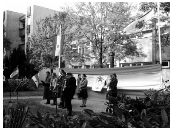
Az Ady Endre - Bay Zoltán Gimnázium diákjainak színvonalas, forradalmi időket felidéző műsorát tekinthették meg az ünnepségre kilátogató sarkadiak