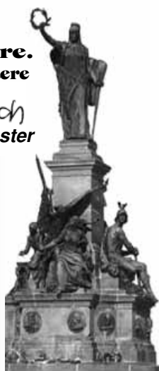
(Az aradi Szabadság szobor)