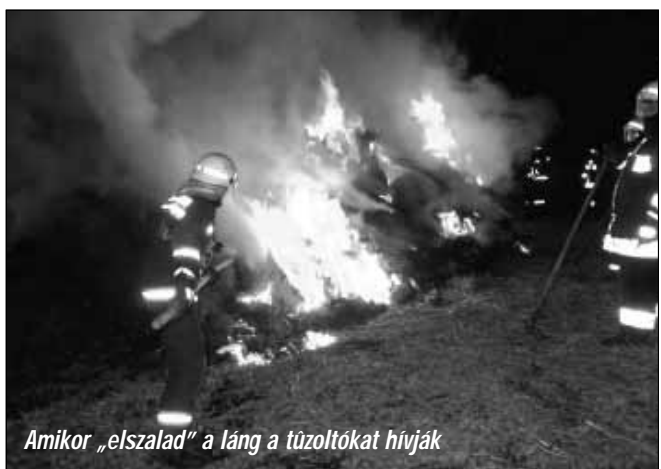
Amikor „elszalad” a láng a tüzoltókat hívják