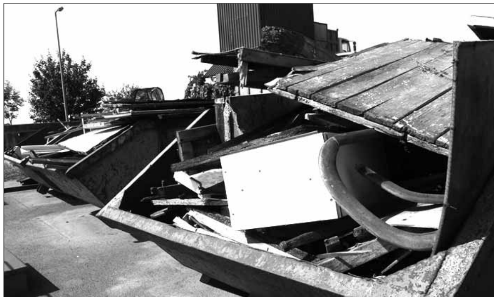
A gyulai hulladékudvaron

Lassan, de biztosan megérkezik idén is a tavasz, így Sarkadon is éledezni kezdenek az udvarok, kertek. Városunkban ilyenkor sokan nekilátnak környezetük rendbetételének, elindulnak a kerti munkák, sokan ilyenkor tesznek rendet portáikon és szabadulnak meg a felgyűlt, szükségtelenné váló dolgaitól. Hál' Istennek városunk lakóinak döntő többsége jogkövető, kulturált módon teszi mindezt. Nekik kívánunk segíteni az alábbi információkkal.