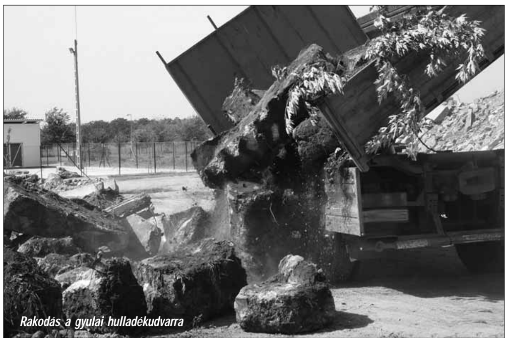
Rakodás a gyulai hulladékudvarra