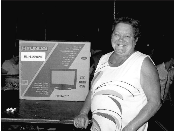
A boldog nyertes a Tanya-Anja panzió által felajánlott fődíjjal

A XIV. sportnapnak reggel 5 órakor lett vége. Mindez nem jöhetett volna létre támogatóink nélkül.