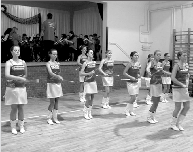
A Csengelei Ifjúsági Mazsorettcsoport