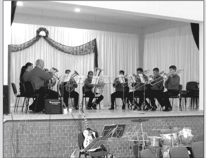
A Kisteleki Rézfúvós Együttes