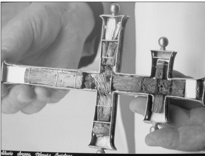
Szent Kereszt ereklye

2009. szeptember 27-én, vasárnap 16 órakor ünnepi szentmise keretében fogadjuk a Lengyelországból érkező Szent Kereszt ereklyét. Erre az ünnepélyes alkalomra mindenkit szeretettel várunk templomunkban.