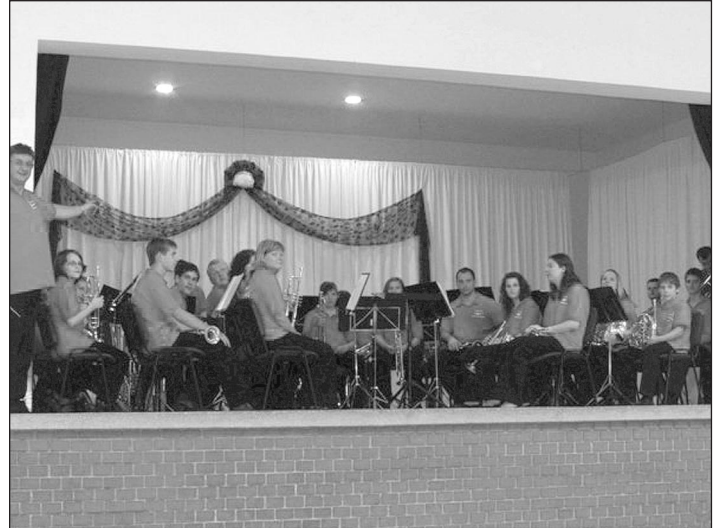
A Csengelei Fúvószenekar

A műsort természetesen a csengelei zenekar és mazzorettsocsoport zárta, akiket már a helyieknek nem kell bemutatni, hiszen nem múlik el úgy esemény Csengelén, hogy ők ne kapnának meghívást rá. A zenekar és a lányok nagy tetszést arattak vendégeink körében.