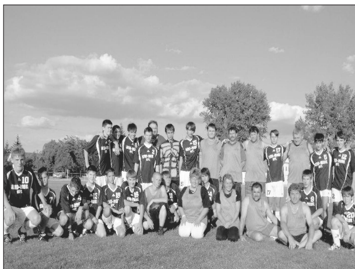
A mérkőző csapatok