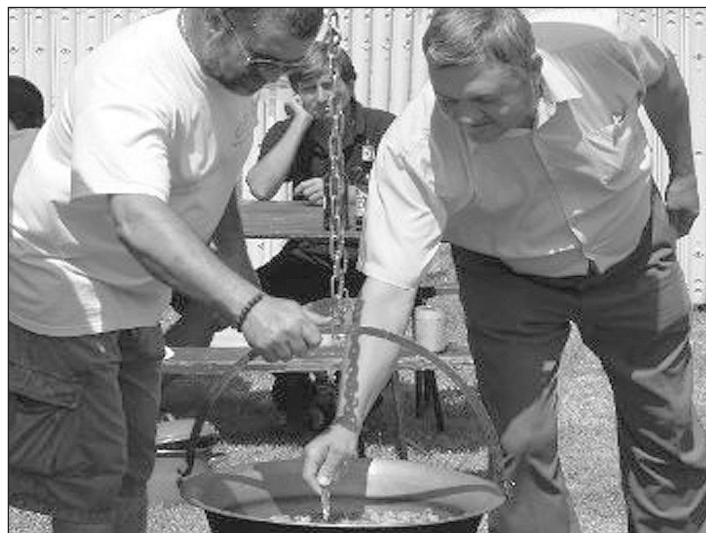
A zsűri elnök kóstol