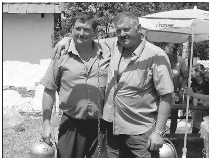
A győztes páros