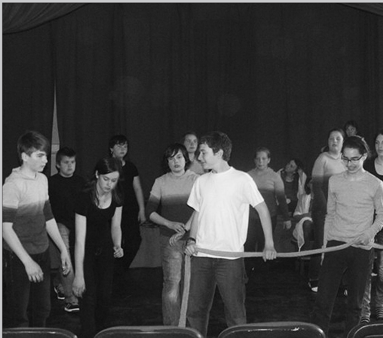
A Főnix Színjátszó Csoport