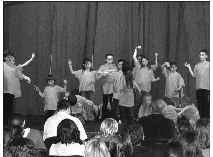
A Napsugár Színjátszó Csoport