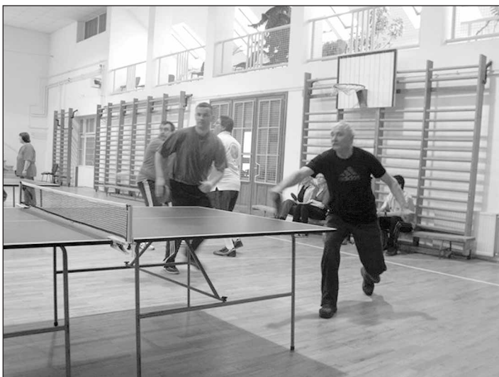
A III. helyezett férfi páros