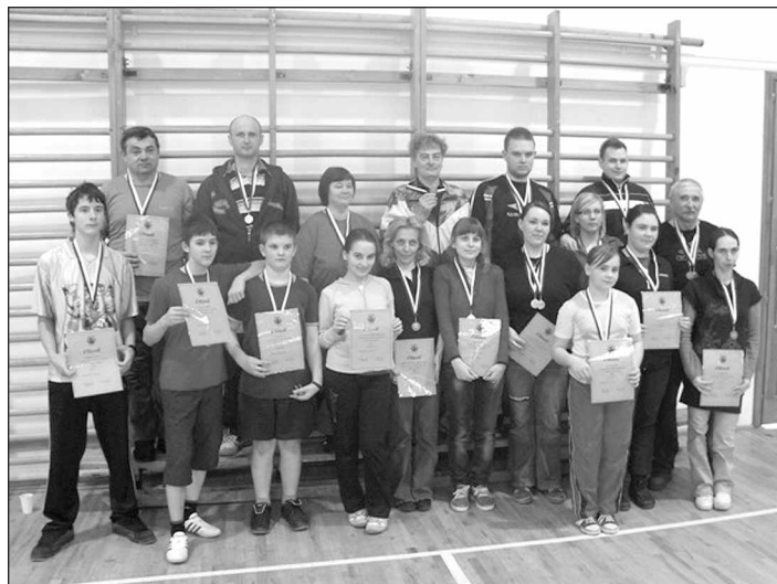
Az érmesek nem teljes létszámban

A helyezettek érmet és emléklapot kaptak. Szendvicsses reggeli és pizzás ebéd volt, melyért köszönet jár a feljárnak és mindenkinek, aki bármilyen módon hozzájárult