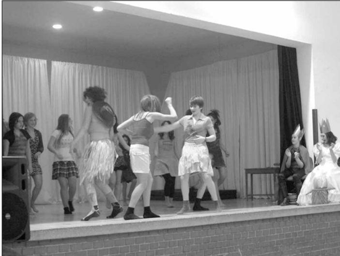
A foci VB "lányai"

A hetedikesekkel beleélhettük magunkat a 2010-es foci VB csodálatos eseményeibe, és megpezsdült a vérünk a szép "lányok" láttán.