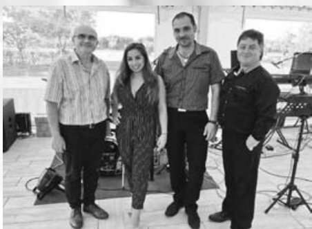
A jó hangulatról a Party Time Band gondoskodik.