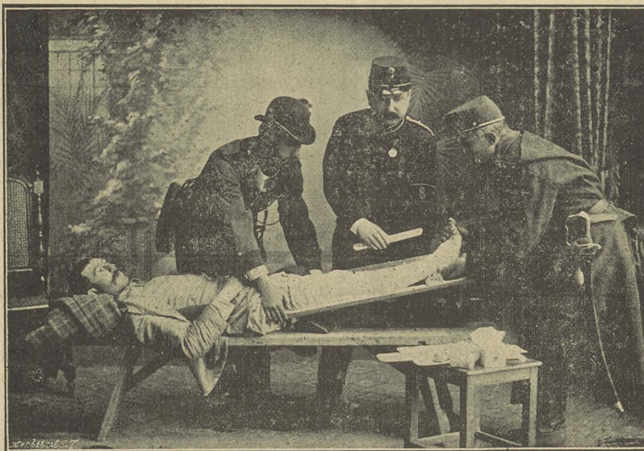
A selmeczbányai rendőrök mint mentők.

példát hozzak föl, sokszor megtörtént, hogy véres verekedést jelentettek be a város valamely távol eső részéből. A kiszálláshoz orvos szükséges, mert nem tudni mi történt, talán súlyos sebesültek vannak. Nosza! orvost keresni. Legjobb esetben bele telt egy óra, a míg egyet találtunk, pedig aránylag elég sok orvos lakik itt.