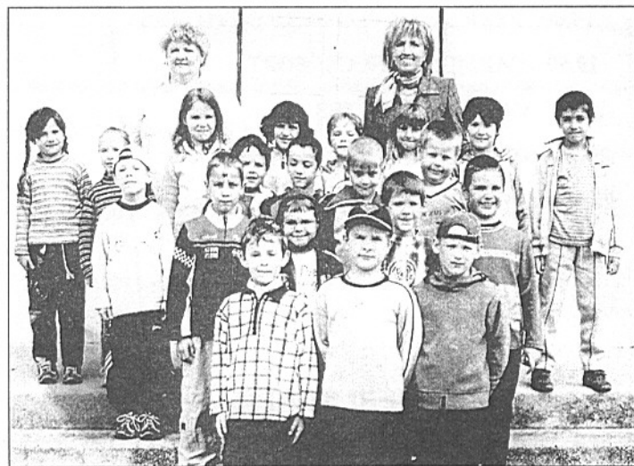
Napsugár csoport: búcsúzó nagycsoportosok