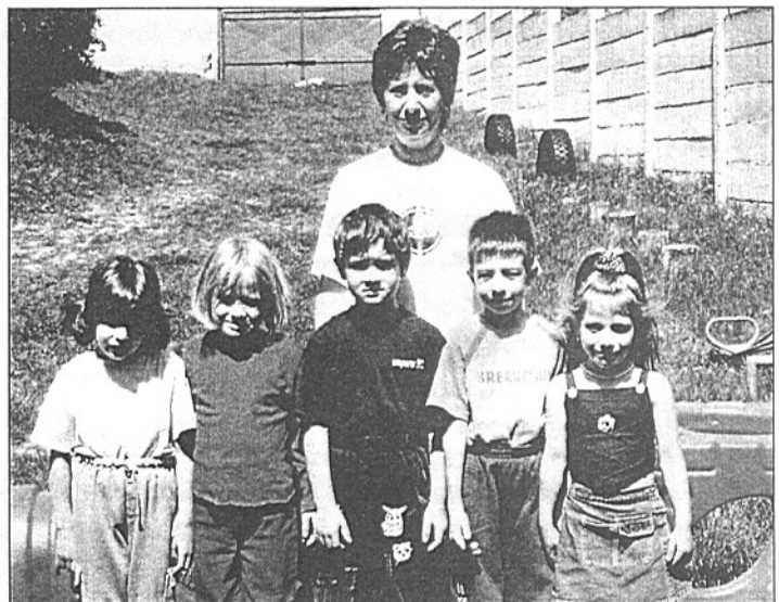
Mazsola csoport: búcsúzó nagycsoportosok