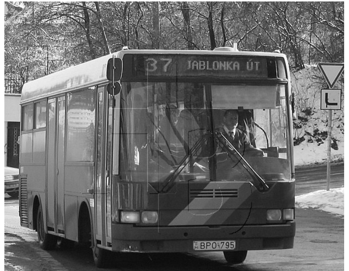
37-es midibusz a Jablonka úton - Ikarus 405

1999-ben egy 137-es viszonylatként közlekedő midibusz az oldalára borult. A baleset követően ezen a vonalon a midibuszokat kivonták a forgalomból. 2006-tól 937-es számmal éjszakai járatot indítottak, következő évtől pedig a 37-es buszt (az azonos számú villamos megkülönböztetése okán) 237-es néven ismerjük, és a két viszonylat menetrendjét is összehangolták. A midibuszok helyett 2011 októberében átmenetileg a 237-es vonalán is Ikarus 260-as típusú járművek álltak forgalomba, melyek Jablonka úti visszafordulása forgalomirányító segítségével történt. Alacsonypadlós járművekkel 2012 óta találkozhatunk a vonalon. 2019 nyarán kigyulladt és teljesen kiégett egy alacsonypadlós Mercedes a Farkastorki út és a Viharhegyi út elágazásánál. Az Óbuda-Hegyvidékiek Egyesületének kezdeményezésére, és a közösségi közlekedést használók örömeire 2022 tavaszán fedett utasváróval gazdagodott a Bécsi út / Vörösvári út hegymeneti buszmegállója.