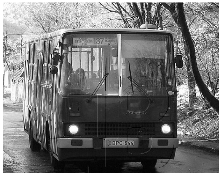
137-es busz az Erdőalja úton - Ikarus 260