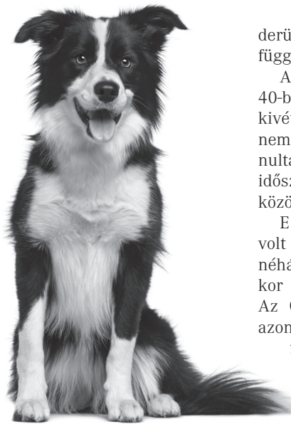
A világ legokosabb kutyája: border collie

A kutyatehetséget az ELTE etológusai vizsgálták. A tehetséget ez alkalommal az emberi