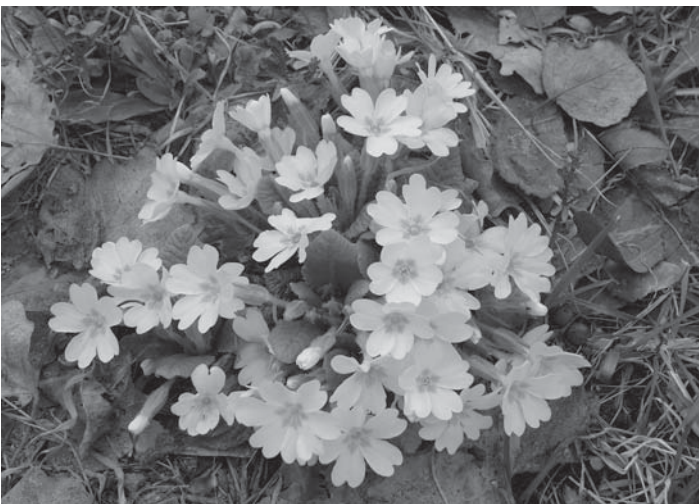
A sárga virágú, szártalan kankalin