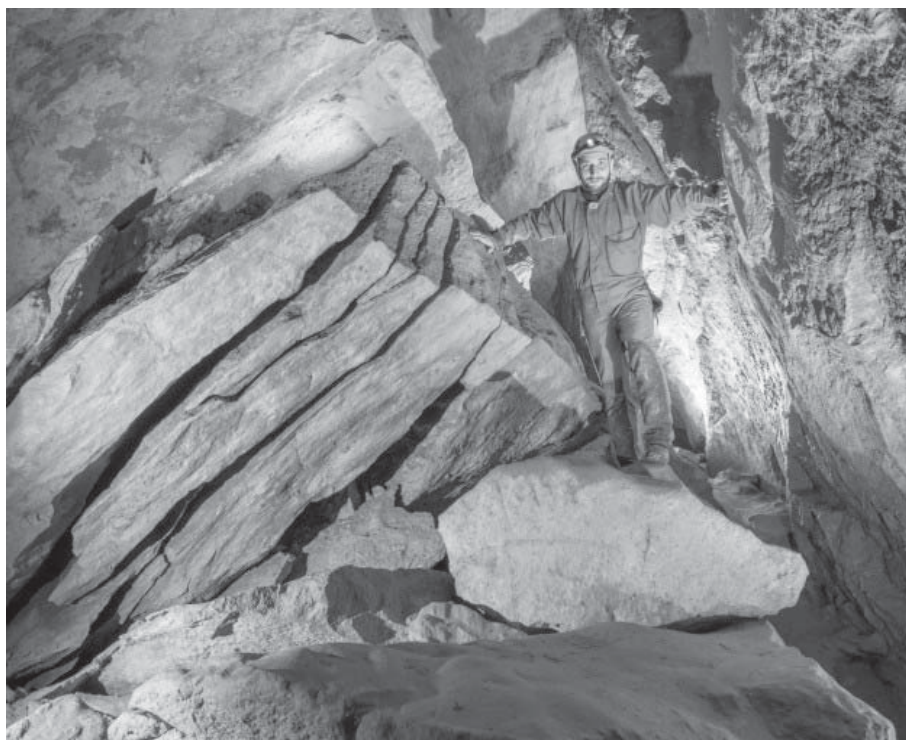
Mátyás-hegyi-barlang - „Könyvtárterem”