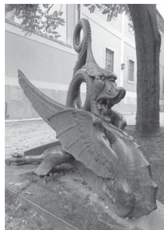
Sárkány a Kiscelli Múzeum bejáratánál

A II. világháború idején a sárkányok túléltek Óbuda ostromát, bár a Kiscelli kastély környékén nagyon heves csatározások zajlottak. Ekkor sérülhettek meg, hiszen a kastély előtt álló sárkány mellő lába hiányzik. Az 1970-es években a három sárkányból kettőt visszavittek a Városligetbe és a Vidám Parkban