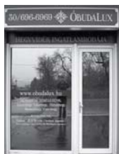
1037 Budapest, Erdőalja út 46.

TESTVÉRHEGY TÁBORHEGY REMETEHEGY MÁTYÁSHEGY ARANYHEGY ÜRÖMHEGY