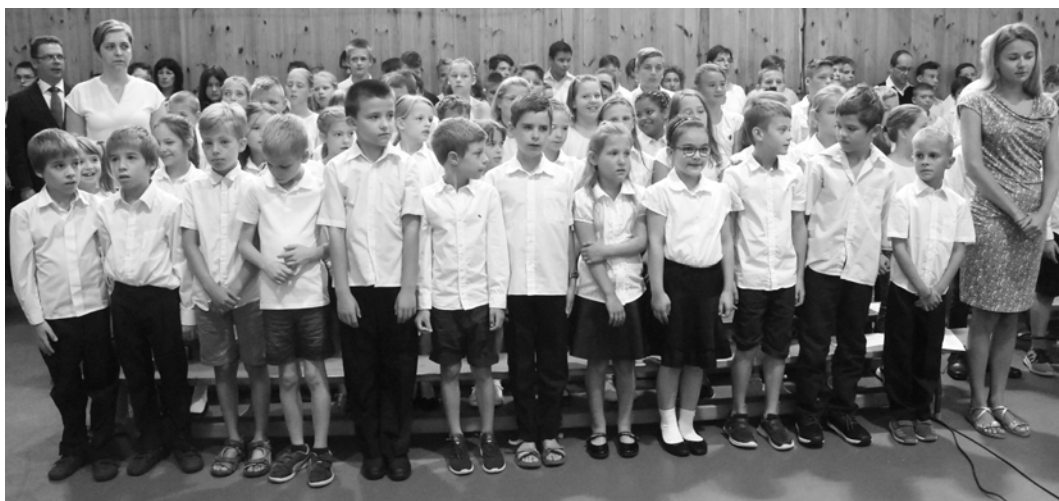
Évnyitó ünnepségünkön a himnuszunkat diákjaink is énekeltek a régi és új pedagógusokkal együtt.

A 70. jubileumi évet flash-mobbal is köszöntöttük. A tetőtéri ablakból nyíló kilátás vetekszik a drón felvétellel. Vagy fordítva? ▼