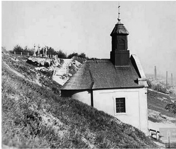
Szent Vér kápolna - fotó 1927.

Ezen források közül a legjobban észrevehető és legállan-