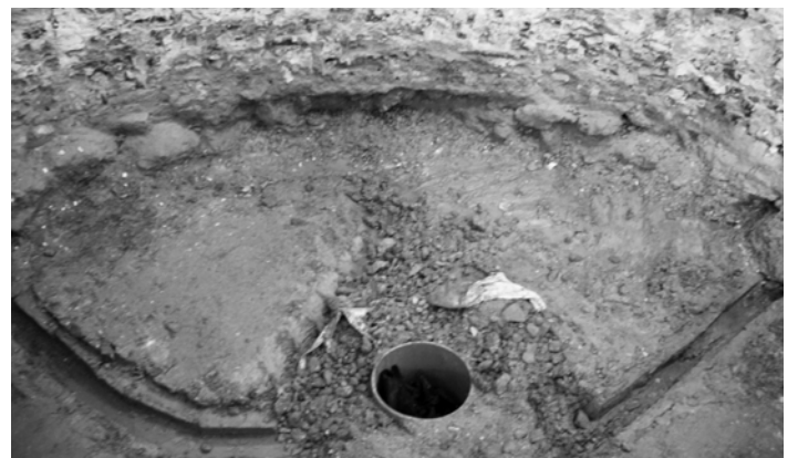
Forrás a szentélypadló alatt