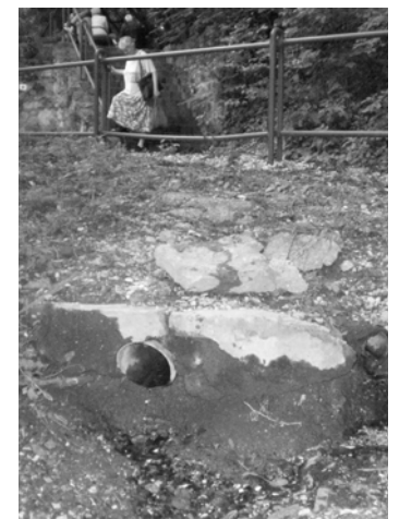
Forráskivezetés a Doberdó sétány alatt