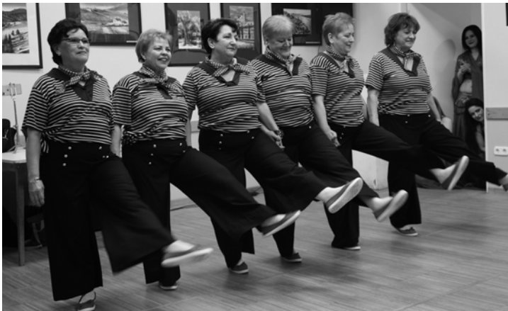
Alerton Klub táncoslábú hölgyei