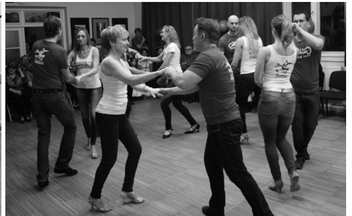
Carmen 2001 Táncstúdió növendékeinek bemutatója.