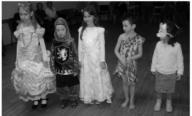
Bella a szépséges Páncélos lovas Királynő Ősember Kismalac