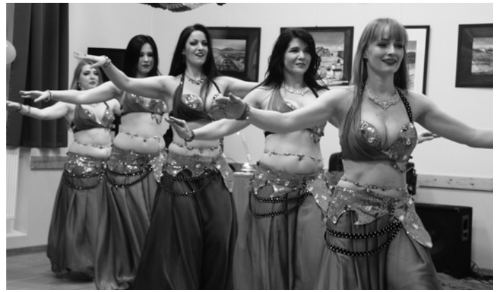
Callista Táncsoport hastánc bemutatója