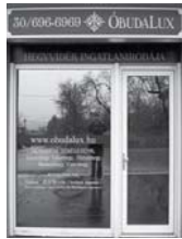
1037 Budapest, Erdőalja út 46.

TESTVÉRHEGY TÁBORHEGY REMETEHEGY MÁTYÁSHEGY ARANYHEGY ÜRÖMHEGY