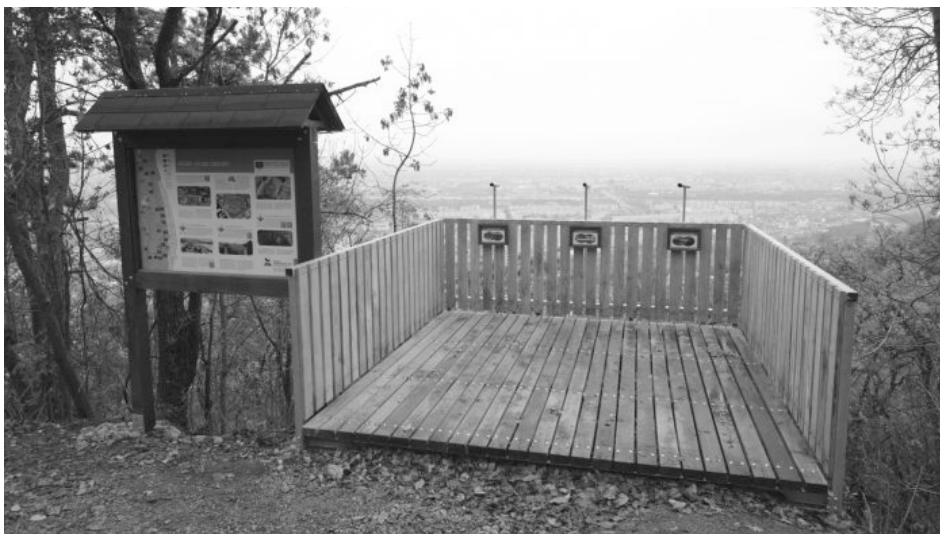
Kilátó terasz a sétány mentén, Óbuda felett

A kiváló magyar erdőmérnök, Guckler Károly (1858-1923) 1895-től lett Budapest Székesfőváros erdőmestere, majd az Erdészeti Hivatal vezetője. Elsődleges feladata, a Budai-hegység fairsításainak megállítása és a károk helyreállítása volt. A nagymértékű erdőpusztulást, a lakosság tűzifaigénye okozta, amelyet a kopár hegyvidék kiábrándító látványa jelzett. Guckler komoly energiát fektetett a munkájába és bátran nyúlt új, modern ötletekhez. Nem a hagyományos tölgyerdő visszaültetését erőltette, hanem főleg feketefenyőket telepített a régi helyre. Ez a fajta meghálálta a bizalmat és jó tűrőképességének köszönhető,