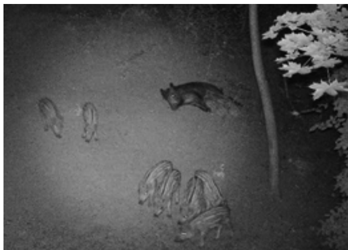
Kamerafelvétel - Tavaszi szaporulat Csíkoshátúéknál a hegyen

- A kertés ingatlanokon élők kertjükben gyakran alakítanak ki komposztáló dombokat, vagy kerítésen kívül helyezik el a lehullott gyümölcsöt, kerti hulladékot. Ahol közel van az erdőhatár, ott az ilyen lerakatok természetes gyűjtőhelyei a földigilisztáknak, kistrágyásoknak, amelyek a vaddisznó részére ízletes élelemforrást jelentenek.