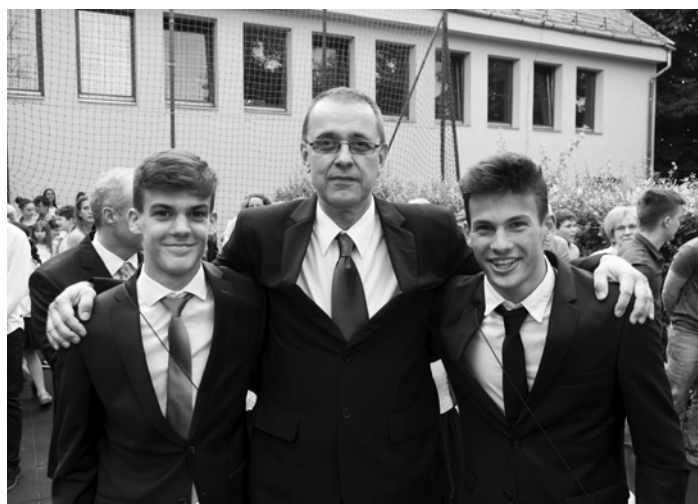
Végzős diákok között