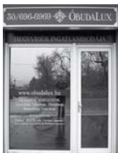
1037 Budapest, Erdőalja út 46.

TESTVÉRHEGY TÁBORHEGY REMETEHEGY MÁTYÁSHEGY ARANYHEGY ÜRÖMHEGY