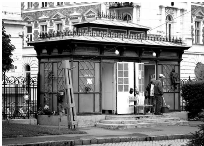
Zöldvillamos a Rózsák terén

Nekem egyébként személyes kötődésem is lenne a kis parkhoz és a régi, szép utcabútorhoz. Az elemi iskolát a Kolossy téri kerületi fiúiskolában jártam végig 1948-tól 1956-ig nyolc éven át naponta jártam el a zöldvillamos mellett. A nyolcadik után már kevesebbet kerültem arra felé, mert az elemi után az Árpád Gimnáziumba kerültem. Nem emlékszem már, hogy mikor zárták be és szüntették meg a kedves, de a végén ugyancsak elég bűdös építményt. Egy dolog azonban máig megmaradt az emlékezetemben a régi zöldvillamosmal kapcs-