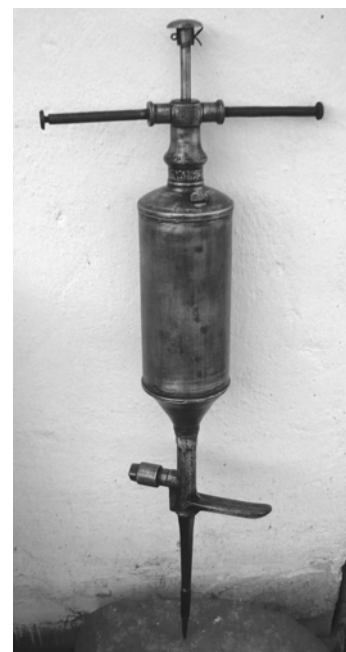
Szénkénegező fecskendő (wuatlspritzn)