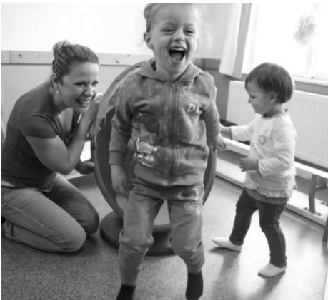
Az áprilisi családi vasárnap egyik pillanata