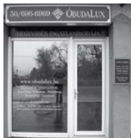
1037 Budapest, Erdőalja út 46.

150 aktuális ingatlant kereső ügyfél, 300 eladó vagy kiadó ingatlan ajánlat