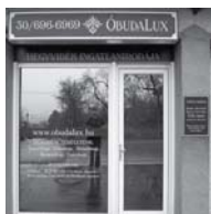
1037 Budapest, Erdőalja út 46.

150 aktuális ingatlant kereső ügyfél, 300 eladó vagy kiadó ingatlan ajánlat