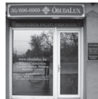
1037 Budapest, Erdőalja út 46.

Hívjon bizalommal! 30-696-696-9, 1-242-1096