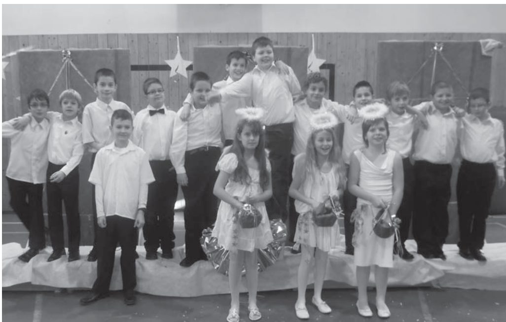
Az egész iskola ünnepelte a 3. b osztály nagyszerű előadását. Igazi karácsonyi hangulatot varázsoltak elénk.