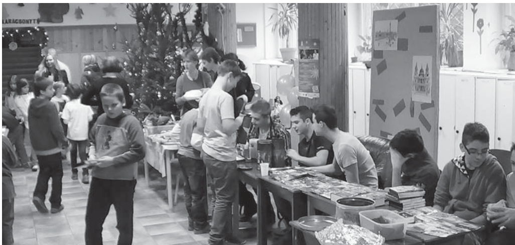
Igazi vásári forgatag lepte el az iskola előterét. Az asztalokra kipakolt kínálat sokakat vásárlásra készítetett.

meg a közönség az előadást. Büszkék vagyunk rá, hogy iskolánkban ilyen tehetséges, kreatív pedagógus kolleganő tanít, aki maga ír, rendez darabot a diákjainak.