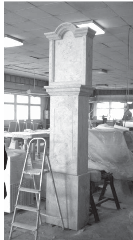
Összeállított stáció oszlop (2013.01.22.)

Restaurálándű stációoszlop kiemelése (2012.12.03.)