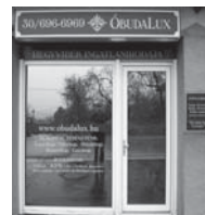
1037 Budapest, Erdőalja út 46.

www.taborhegyi.hu www.remetehegyi.hu www.matyashegyi.hu