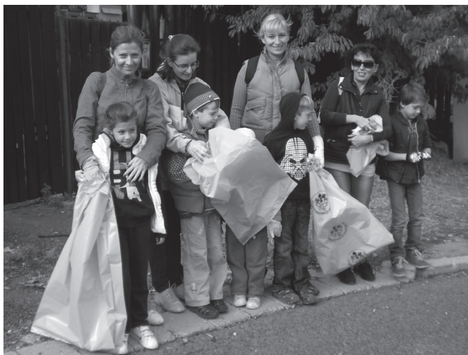
Az őszi takarítás munkájából az elsősök is kivették részüket. Noszogatók nélkül, vidáman gyűjtötték zsákokba az utcára nem illő papírokat, flakonokat.