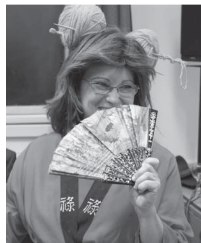
Felhött farsangoló a mosohyógó a japán gésa