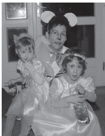
Farsangi jelmezeseik közül két angyalka